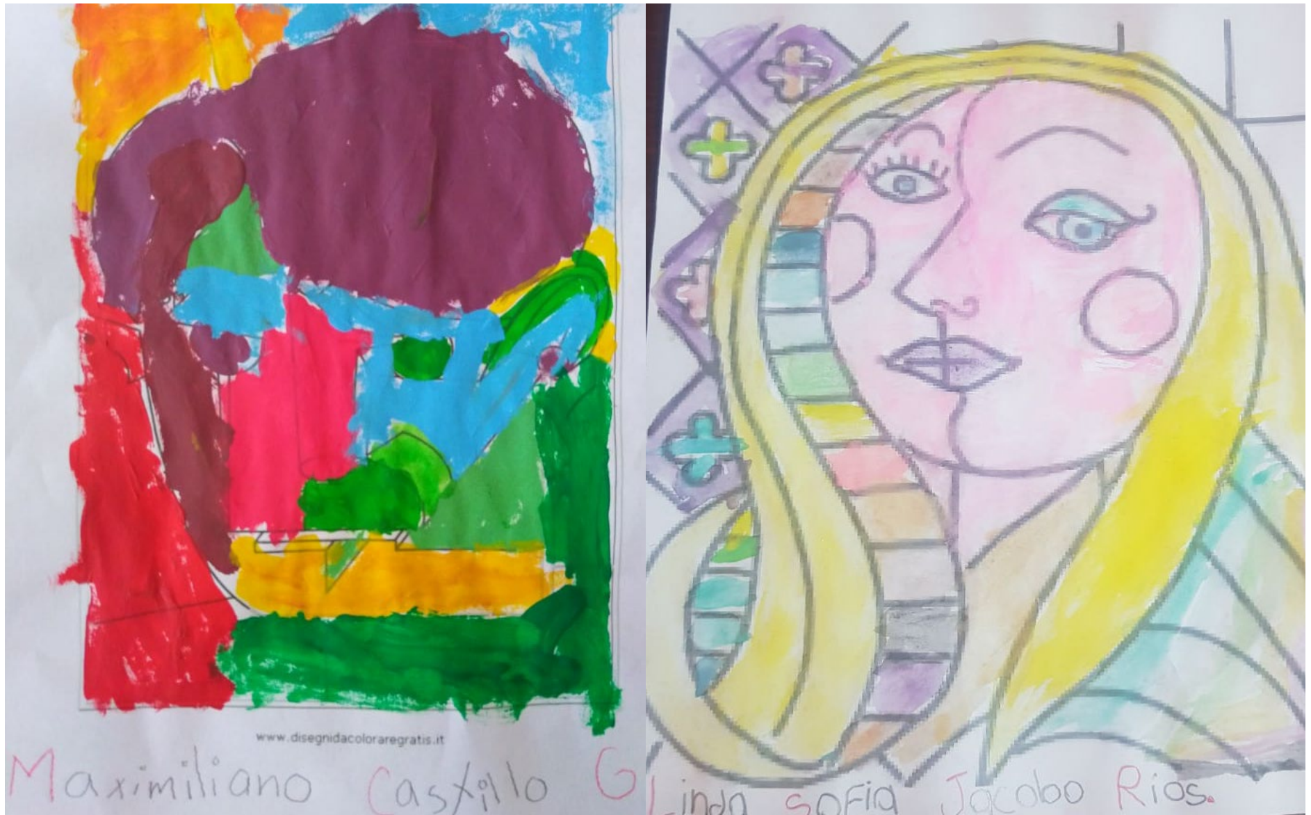
Evidencias de trabajo del estilo artístico de cada alumno