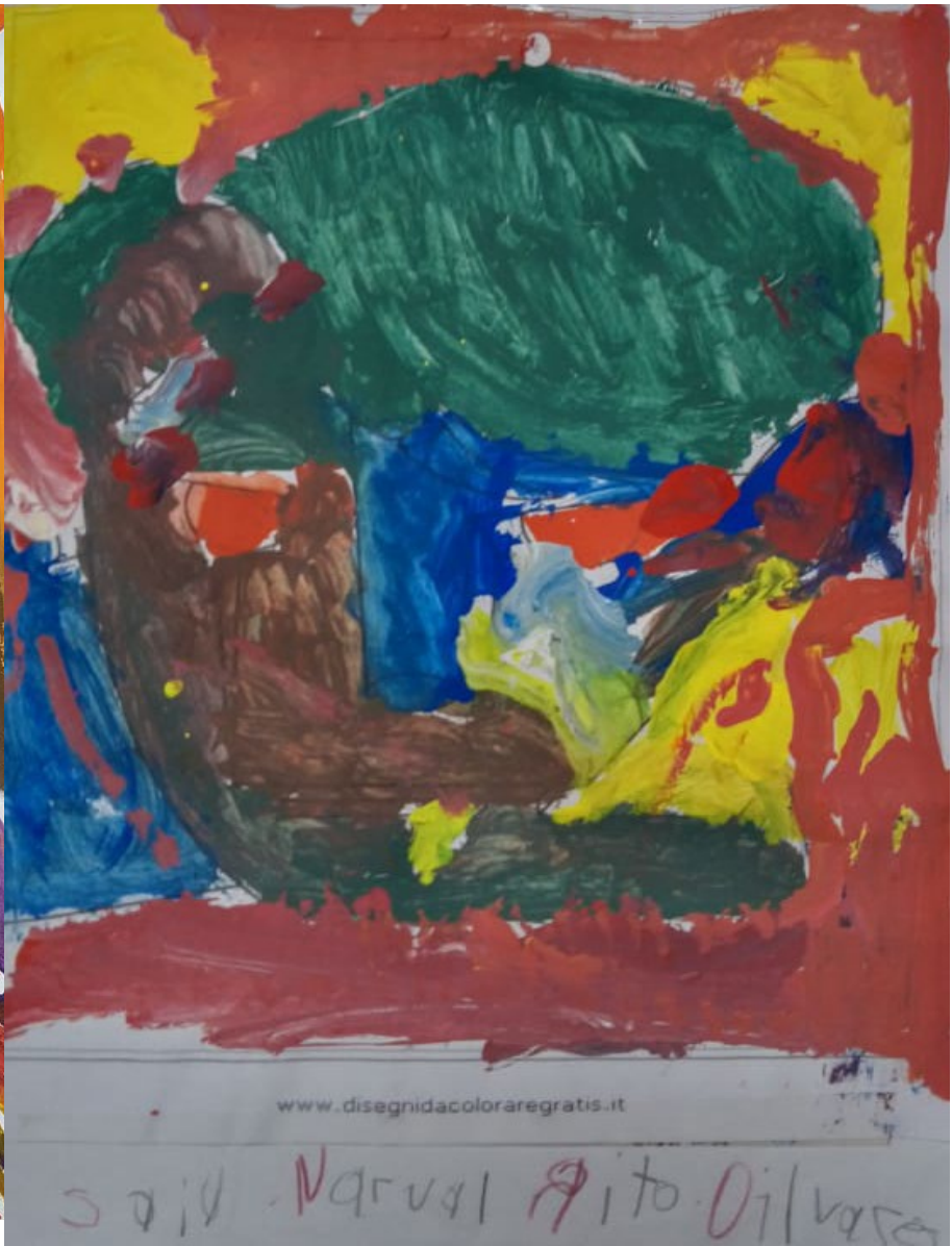
Evidencias de trabajo del estilo artístico de cada alumno