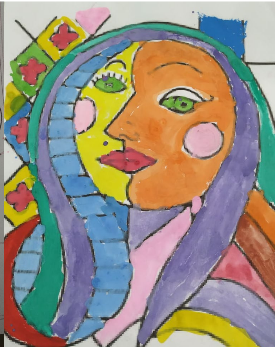
Evidencias de trabajo del estilo artístico de cada alumno