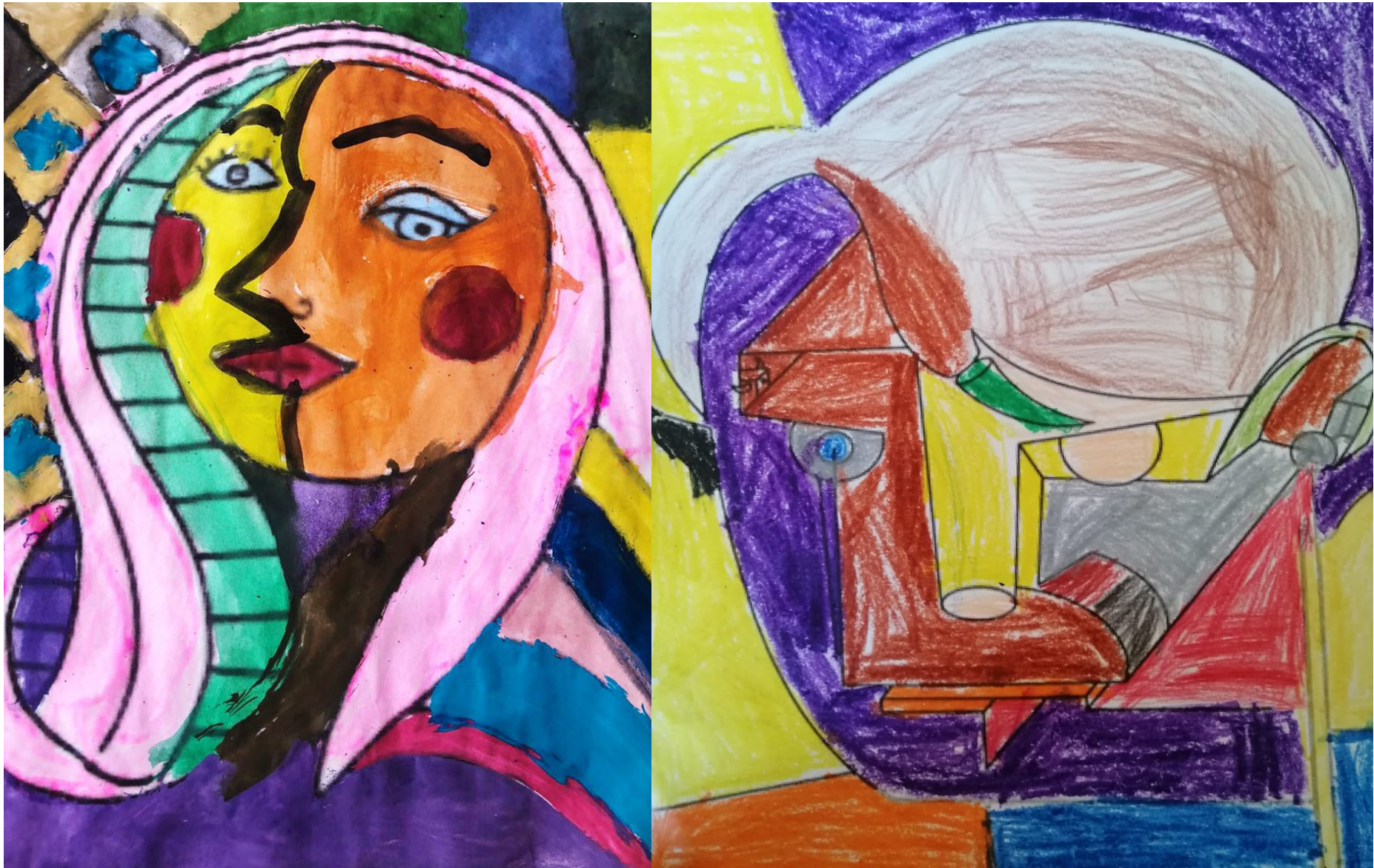
Evidencias de trabajo del estilo artístico de cada alumno