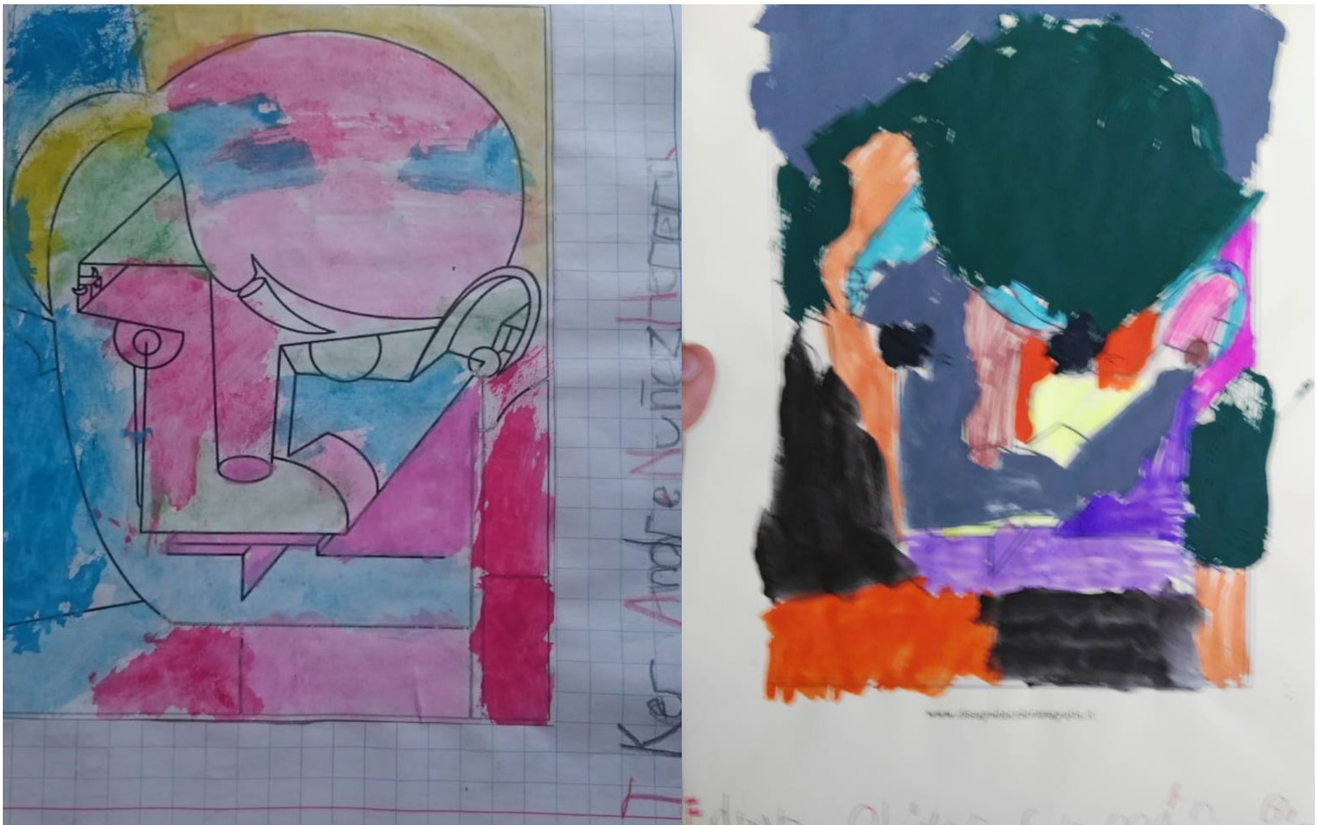
Evidencias de trabajo del estilo artístico de cada alumno