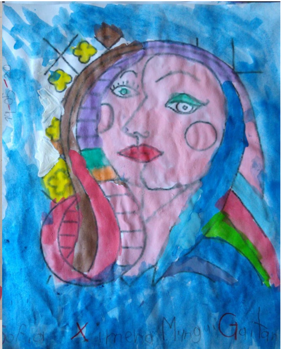
Evidencias de trabajo del estilo artístico de cada alumno