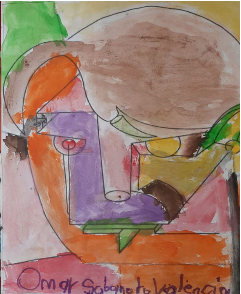
Evidencias de trabajo del estilo artístico de cada alumno