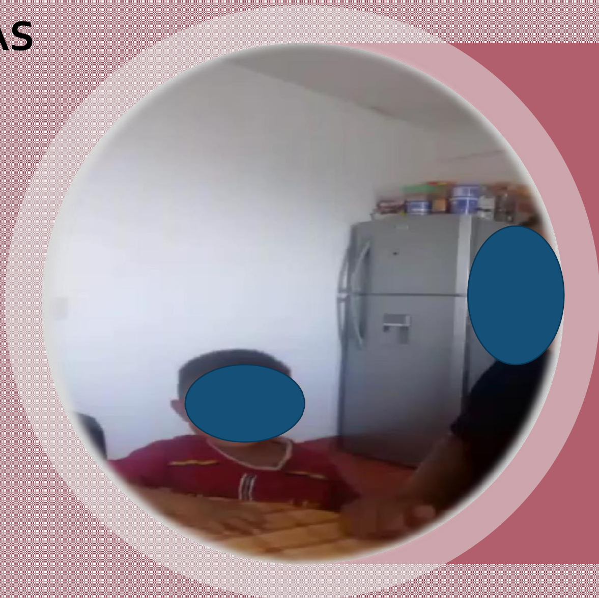
Evidencia de trabajo