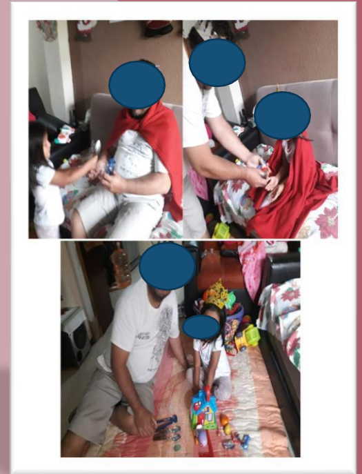
Evidencias de trabajo de actividades en casa