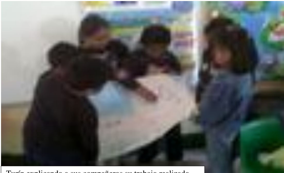
Turín explicando a sus compañeros su trabajo realizado sobre el cuidado del agua.