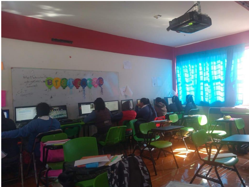
APLICACIÓN DEL EXAMEN