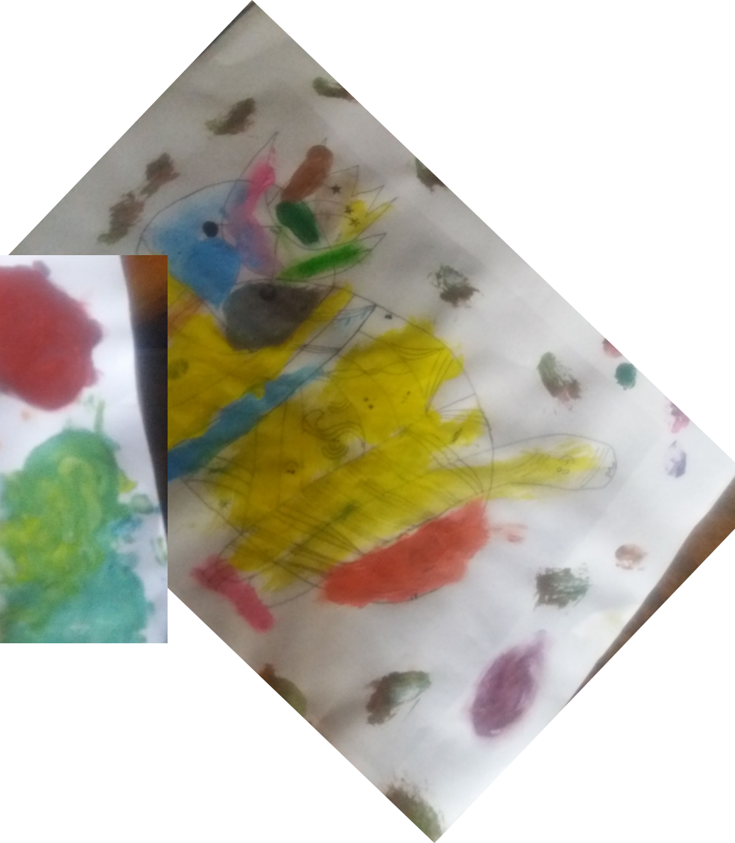
Evidencia de trabajo de las creaciones artísticas de loa alumnos