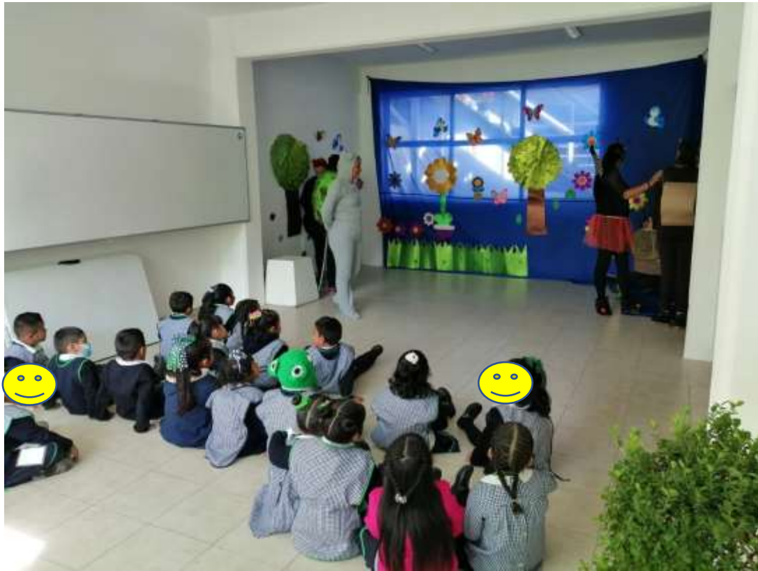
presentación teatral de emociones