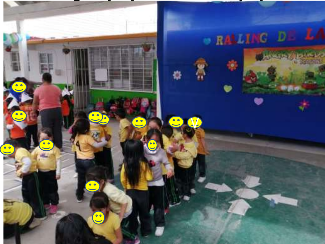
Juego apoyando a su equipo.