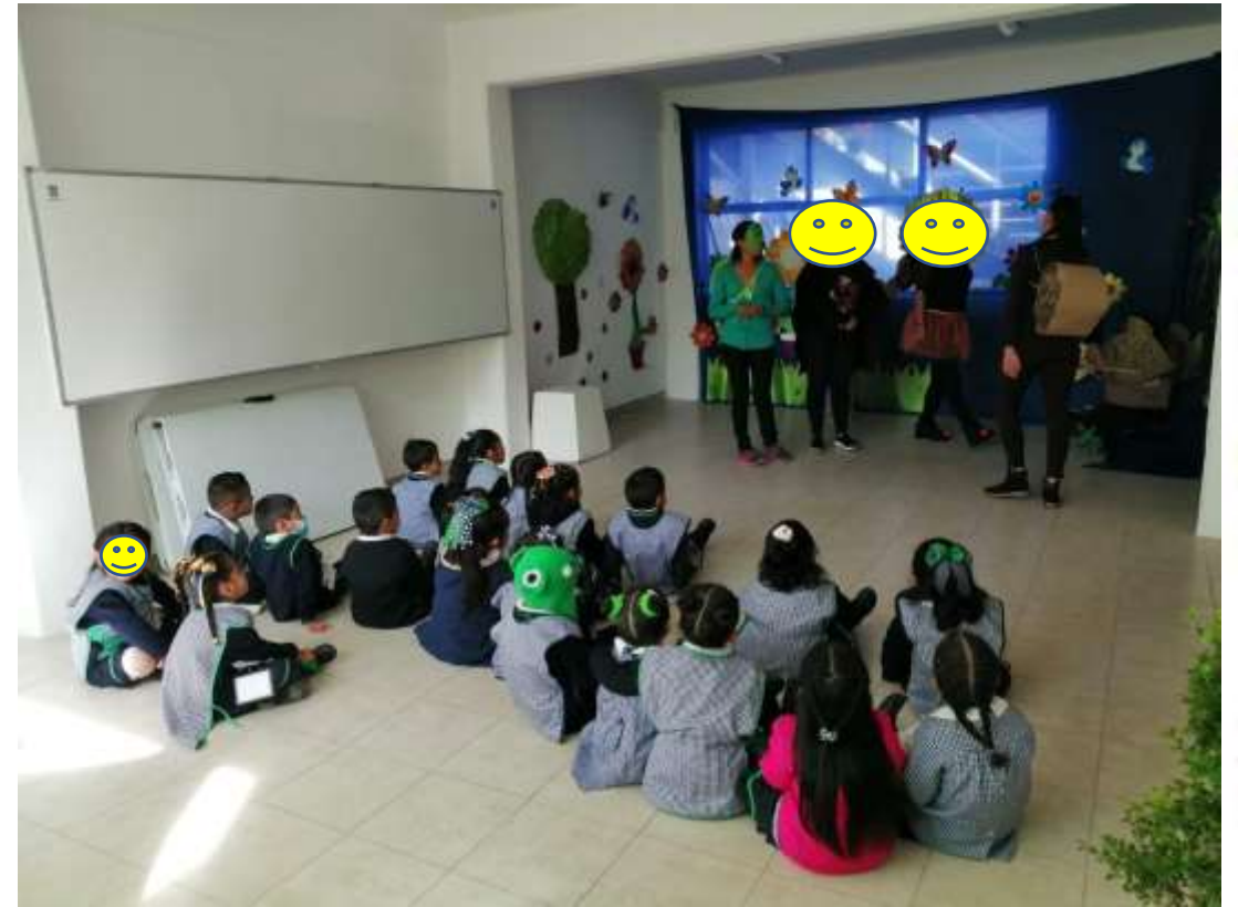
presentación teatral de emociones