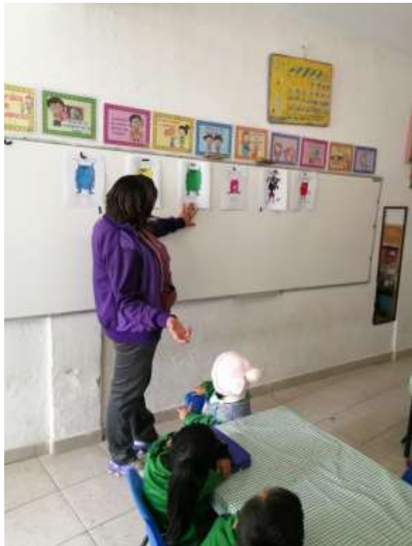
Trabajo en el salón de clases.