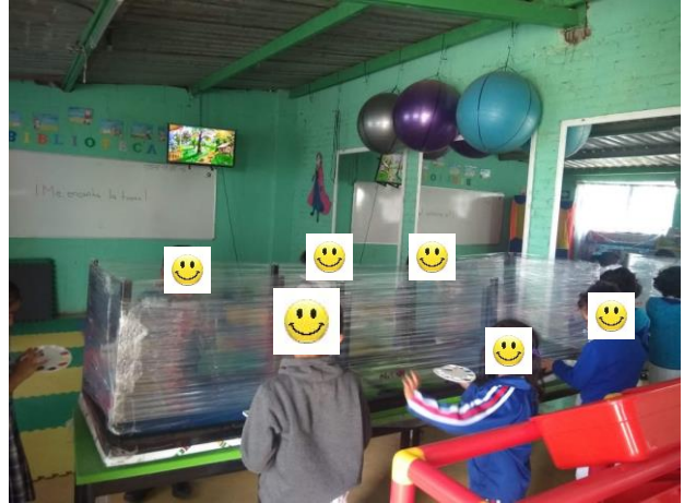
Evidencia de trabajo, pintores