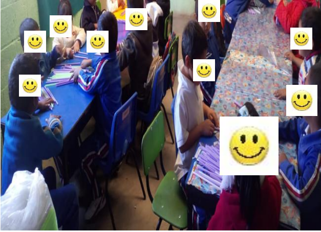
Evidencia de trabajo, creando