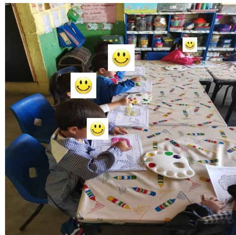
Evidencia de trabajo, pintores