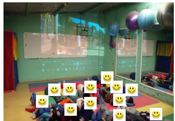
Evidencia de trabajo, Exposición