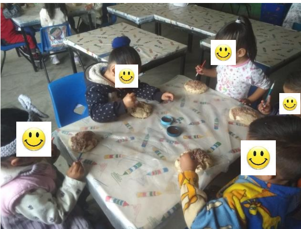
Evidencia de trabajo, pintores