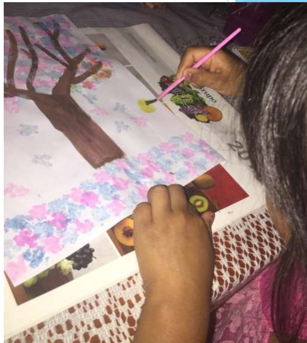
PRODUCCIONES DE LOS DIBUJOS REALIZADOS POR LOS NIÑOS Y NIÑAS DE 3ºB