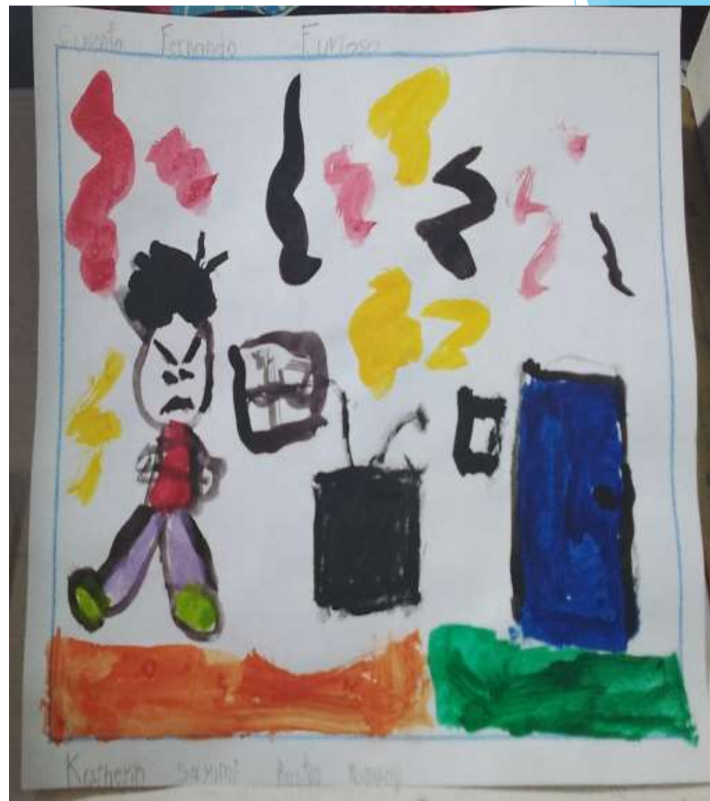
PRODUCCIONES DE LOS DIBUJOS REALIZADOS POR LOS NIÑOS Y NIÑAS DE 3ºB