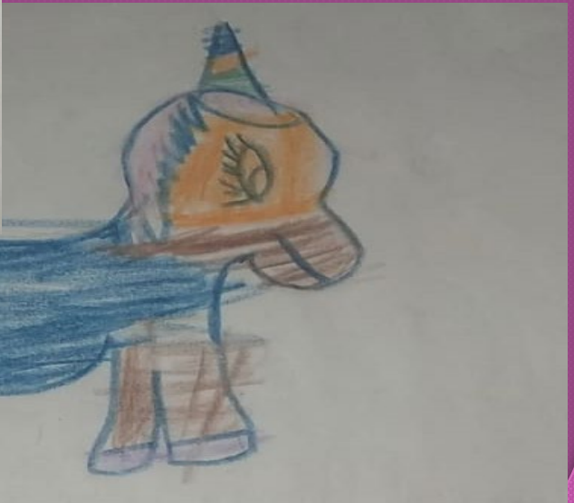
Evidencias de las actividades realizadas "contando"