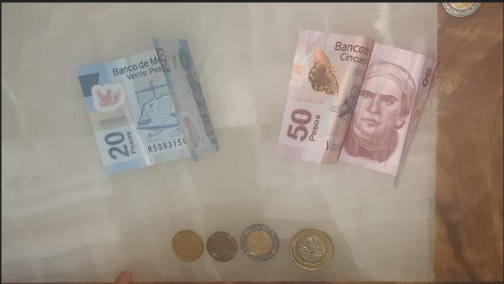
Evidencias de trabajo de la tiendita