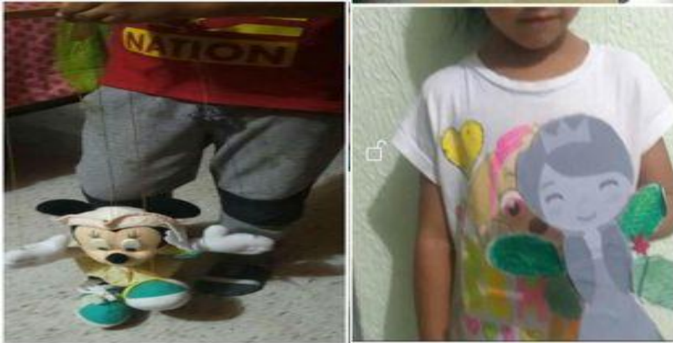
Evidencia de trabajo con títeres