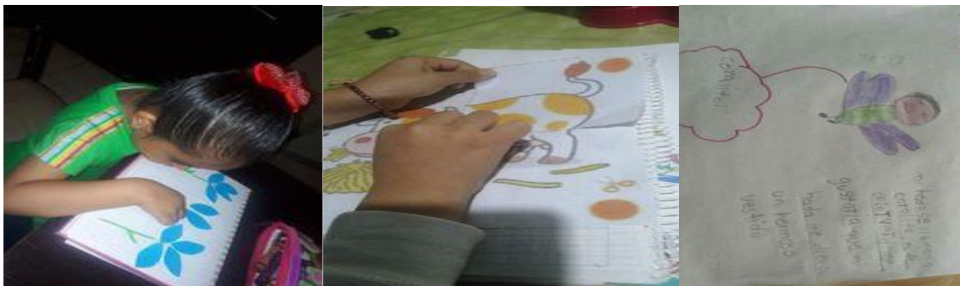
Evidencia de creación de cuentos