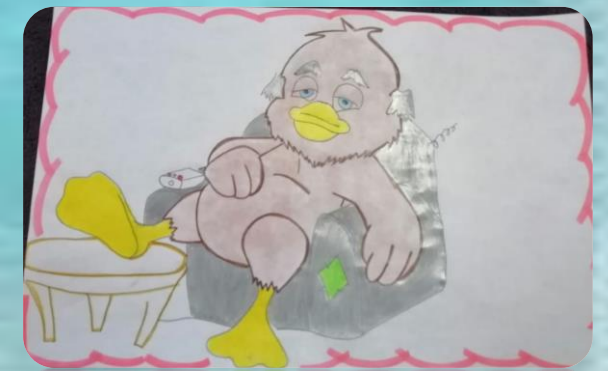
Evidencias de las actividades de los alumnos