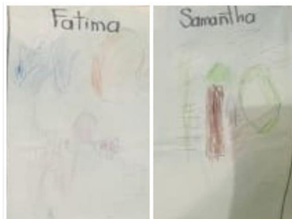
evidencia de trabajo

Realizaron un boceto a lápiz para después reproducirlo sobre el espacio destinado para el mural.