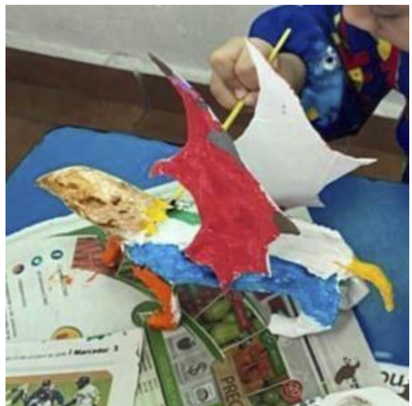
Evidencia de trabajo, procesos de elaboración