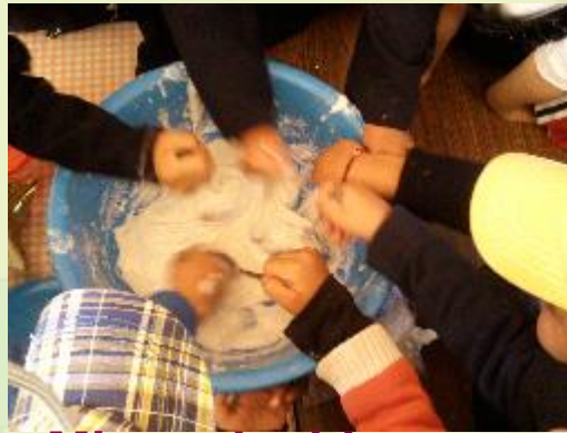
Mix and add

1.- mix the sugar with the albumen 2.- add the color and mix 3.- decorate your cookies