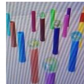
TABLA DE UNIGEL DELGADA POPOTES DE COLORES POMPONES DE COLORES PINZAS PARA ROPA

Aprendizaje esperado: Utiliza herramientas, instrumentos y materiales en actividades que requieren de control y precisión en sus movimientos