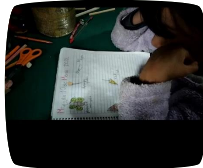
Anexo algunas evidencias en fotografías y videos.