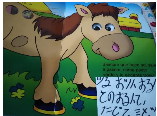
Conociendo escritura china cuento "caballitos"