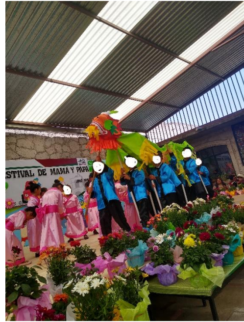
Presentación del número artístico “chinescas”, implementando el “dragón chino”