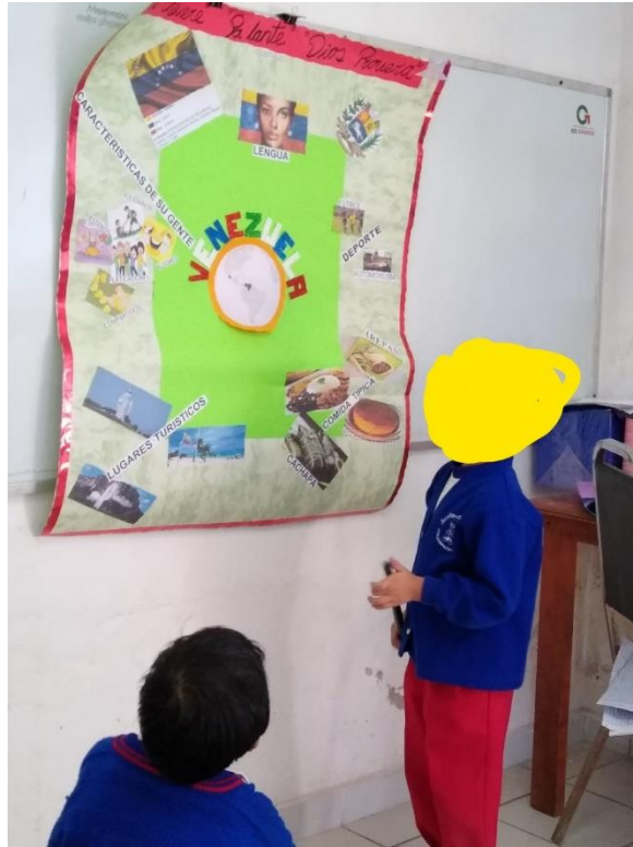
exposición del país de Venezuela por un alumno