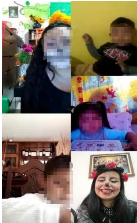
Figura 1. Reunión virtual “Festividades del día de muertos”

Nota. Actividad de la lotería de día de muertos, en donde se implementó la estrategia de “ilustraciones”.