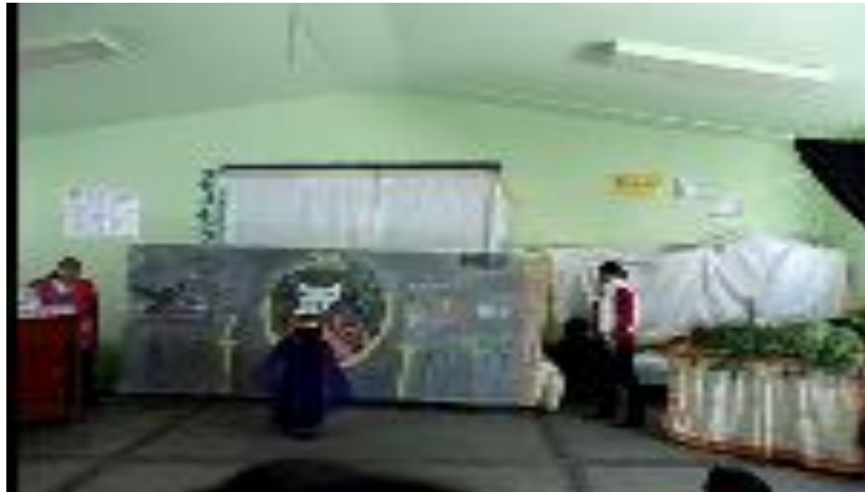
Evidencia de la presentación teatral

Al trabajar la situación didáctica cuentos dramatizados los alumnos en todo momento se mostraron interesados en opinar sobre los espacios, materiales y vestuario que estuviera acorde a lo que iba cada uno a representar.