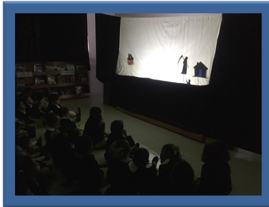
presentación de un cuento

Las niñas y los niños con apoyo de sus padres de familia, realizan la presentación del cuento.