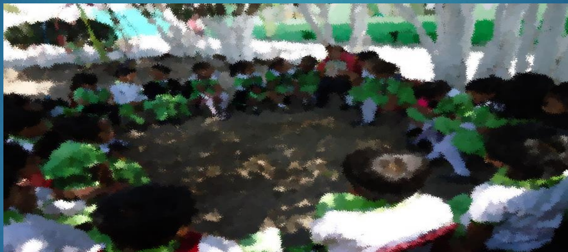
Evidencia de la lectura en grupo

En la escuela se trata de buscar diferentes espacios para la lectura que sean agradables a las niñas y niños, creando ambientes que permitan, confianza, seguridad, para que al termino de la lectura se pueda participar con reflexiones y análisis.