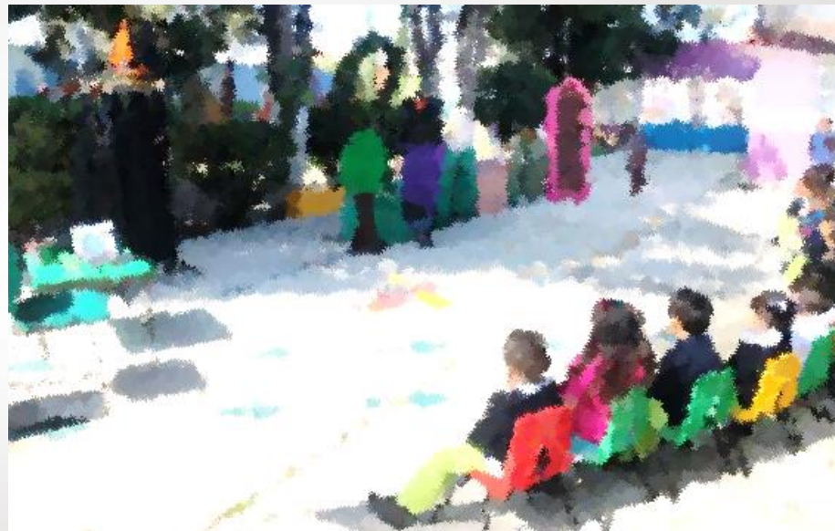
Evidencia de la presentación teatral

❖ En nuestra escuela se utiliza esta estrategia con frecuencia pues constituye una actividad significativa para los alumnos, además de que de esta forma los alumnos observan en primera instancia la representación por parte de padres de familia, para posteriormente ellos mismos lograr representar sus propios personajes.