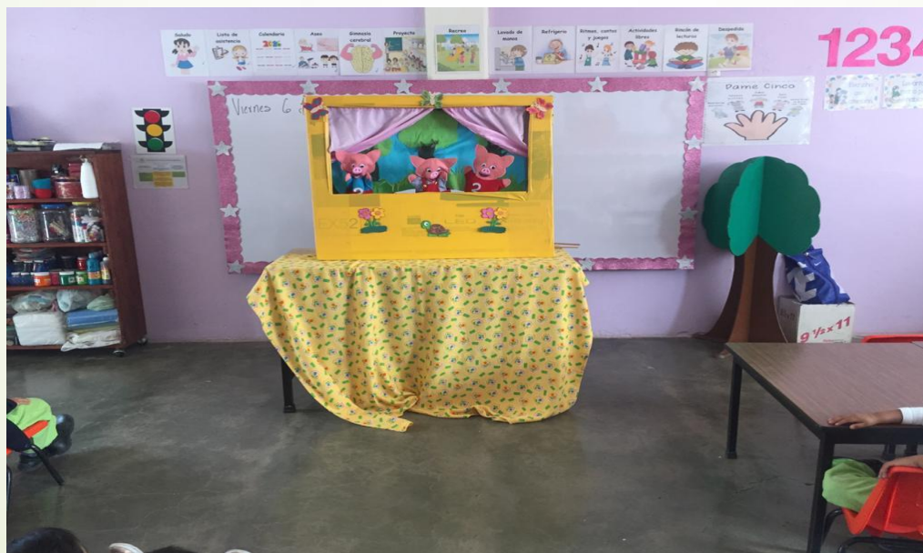
presentación con títeres