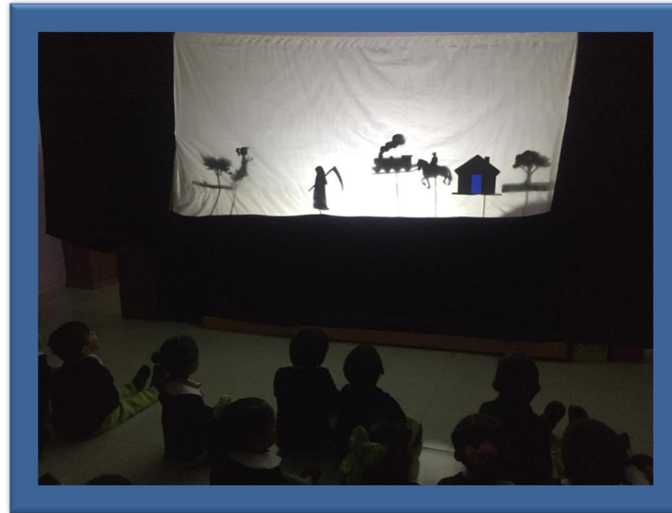
Evidencia de la actividad