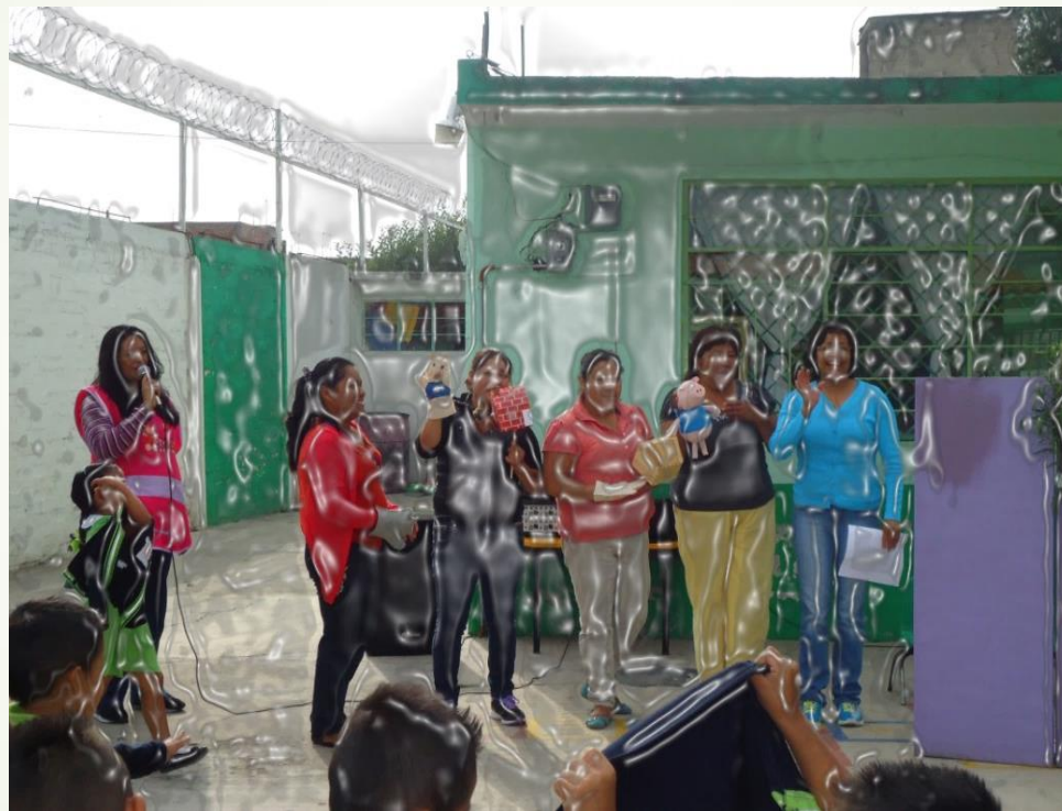
organización de las actividades

Los títeres les permiten a los niños desarrollar su creatividad e imaginación y estimulan su comprensión, ya que en algunas veces tienen que interactuar con los personajes.