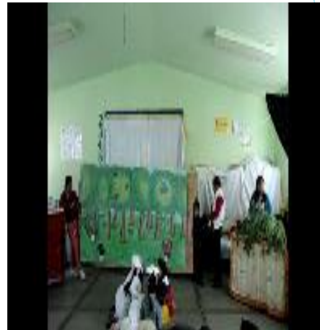
Evidencias de la presentación teatral en el aula clase