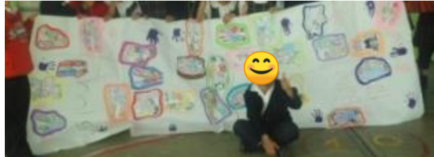
Ilustración 2. Cuarta sesión "Entre pasillos" actividad: Mural "menos bullying, más amigos"