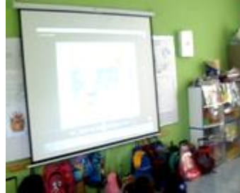
Ilustración 1. Aula de tercer grado, sesión “Apantállame”