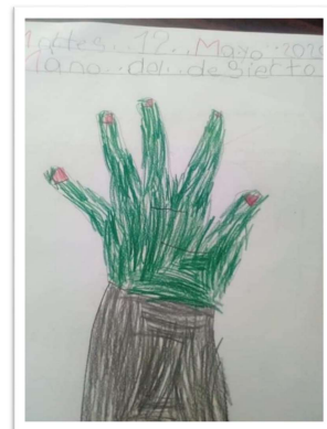
Evidencias del trabajo en casa

EMILIA FERREIRO: En lugar de preguntarnos si “debemos o no debemos enseñar a leer y escribir en preescolar” hay que preocuparse por DAR A LOS NIÑOS OCASIONES DE APRENDER. La lengua escrita es mucho más que un conjunto de formas gráficas. Es un modo de existencia de la lengua, es un objeto social, es parte de nuestro patrimonio cultural.