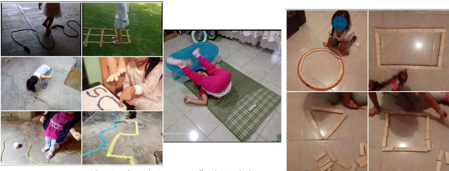
Evidencias de trabajo en casa "trabajando las emociones"

También nos apoyábamos de diversas disciplinas como el Yoga o zumba para niños con el fin de diversificar las actividades y atender a las necesidades de todos los alumnos, incluso las emocionales. Con respecto a esto, también se proponía una vez a la semana analizar alguna temática que mostrara al alumno los estados de ánimo que podemos experimentar, proponer algunas estrategias para resolver situaciones que nos generan malestar y comunicar de manera asertiva nuestros sentimientos, además enviábamos algunas recomendaciones y tip's para padres de especialistas que buscábamos en la red. Esta estrategia fue un apoyo significativo al analizar el libro para las familias y comprender la importancia de la intervención en el proceso de enseñanza aprendizaje de sus hijos.