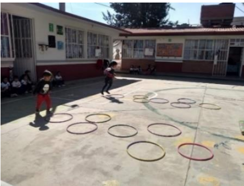
Imagen 10 “Circuito de acción motriz”. Clase de educación física en donde los estudiantes ponen en práctica sus habilidades motrices y cognitivas. Jardín de Niños “Carlos Mérida” (11/09/2019)

La actividad del circuito de acción motriz para encontrar mi nombre (Imagen 10) consistía en que los estudiantes a partir de estaciones de trabajo de forma secuencial que requirieran poner en práctica sus habilidades motrices, fuese una oportunidad para identificar qué alumnos iban avanzando en el logro del aprendizaje, debido a que al finalizar el circuito se encontraban todas las tarjetas con el nombre o los nombres de cada estudiante y ellos tenían que identificar cuál era el que les correspondía, esta actividad me permitió comprobar que la educación física no es un área aislada en mi práctica, sino que forma parte del desarrollo integral de los estudiantes.