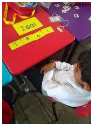
Imagen 3 y 4 “Rompecabezas de mi nombre”. En las imágenes dan muestra del material que se utilizó para la actividad. Jardín de Niños “Carlos Mérida” (04/09/2019)