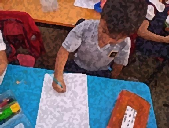
Imagen 12 “Cartel de medidas de higiene para mantenernos a salvo”. Los estudiantes a partir de su creatividad elaboraron carteles informativos. Jardín de Niños “Carlos Mérida” (02/03/2020)

Conforme los medios de comunicación daban a conocer que los espacios en los que se reuniera una cantidad de personas de manera masiva eran consideradas zonas de riesgo, las medidas que tomaban las escuelas aumentaban a partir de las indicaciones oficiales en materia de salud pública, una de ellas, fue el llenado de un formato en el que los tutores de los niños y niñas debían responder si en los últimos días ellos o una persona cercana recientemente había salido del país, si habían presentado alguno de los síntomas que las autoridades del sector salud anunciaban, entre otras preguntas.