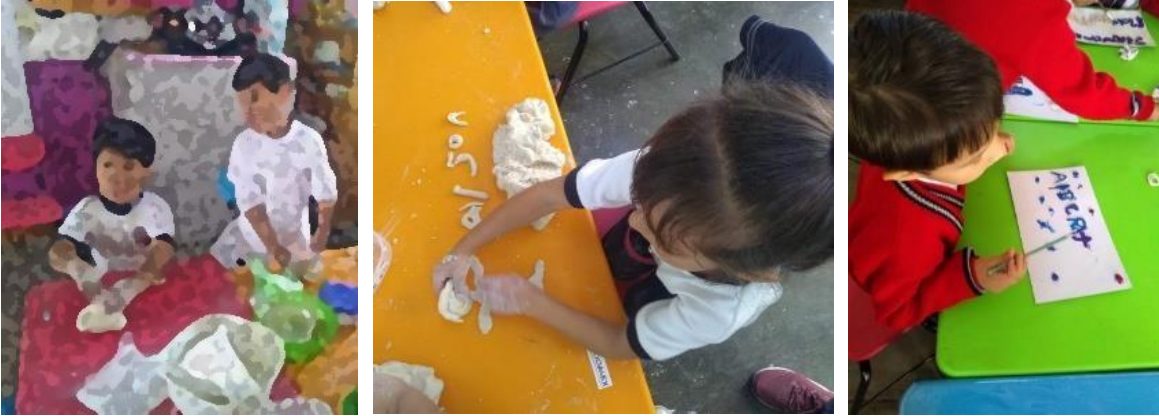
Imagen 7, 8 y 9 “Mi nombre con masa de sal”. Los pasos que los niños y niñas hicieron para culminar con la escultura de su nombre propio. Jardín de Niños “Carlos Mérida” (10/09/2019)

Actividad 13. Exposición de ¿Quién eligió mi nombre? Y ¿Qué significa mi nombre?