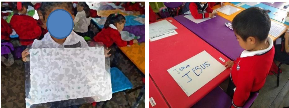
Imagen 5 y 6 “Pizarrón mágico”. Primer día utilizando pizarrón mágico para la escritura del nombre propio. Jardín de Niños “Carlos Mérida” (09/09/2019)

Al día siguiente la actividad constaba en hacer la escritura de su nombre pero ahora en un espacio más reducido y con otro tipo de materiales para que ellos fueran practicando sin que fuese repetitiva la actividad, se solicitó a los padres con tiempo de anticipación el material, el cual era algo novedoso para los alumnos ya que lo denominamos pizarrón mágico, (Imagen 5 y 6) esto fue un estímulo porque cada uno tenía su propio pizarrón, marcadores y un trapo para que tuvieran la posibilidad de borrar con facilidad e intentar las veces que consideraran necesarias, por un lado el pizarrón es blanco y por el otro tiene cuadrícula, ellos decidían el espacio en el que se sentían más seguros de escribir a partir del tamaño de sus letras.