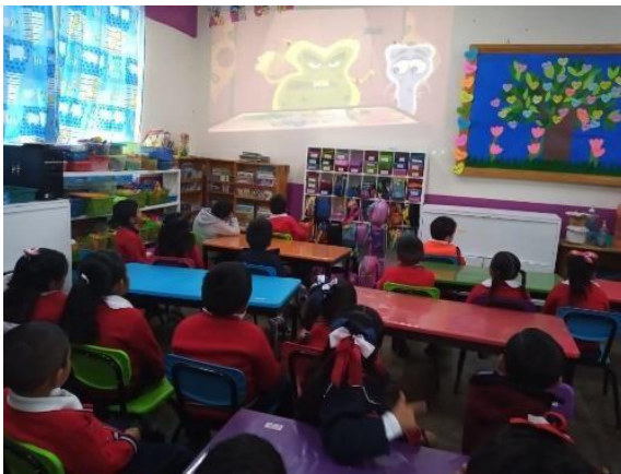
Imagen 11” Proyección de video acerca de las medidas de higiene para prevenir enfermedades”. En la fotografía se muestra que se le esta dando a conocer a los estudiantes la problemática de salud por la que se enfrenta el país. Jardín de Niños “Carlos Mérida” (02/03/2020)

(Anexo 3) con las cuales se tenía la intención de orientar a los estudiantes acerca de los síntomas que presenta una persona que tiene una enfermedad respiratoria y la importancia de hacerle saber a su tutor cuando ellos se sienten mal para que los puedan llevar con un médico y tratar la enfermedad de manera profesional, también se les colocaron videos informativos en los que se trataban temas de salud e higiene, por ejemplo, la manera correcta de estornudar y el lavado de manos, (Imagen 11) al inicio del ciclo escolar ya se había trabajado con los estudiantes acerca de las medidas del cuidado personal, pero la enfermedad al ser una situación de extrema atención se dio un repaso.