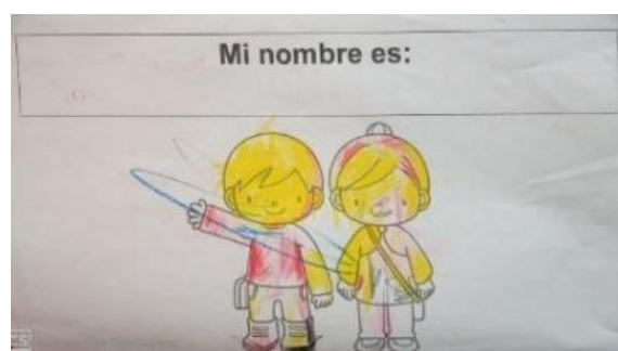
Imagen 1 y 2 “Mi nombre es importante”. Trabajos realizados por estudiantes del grupo 3ro. “A” acorde a la actividad “Escritura de su nombre en una hoja diagnostica”. Jardín de Niños “Carlos Mérida” (02/09/2019)