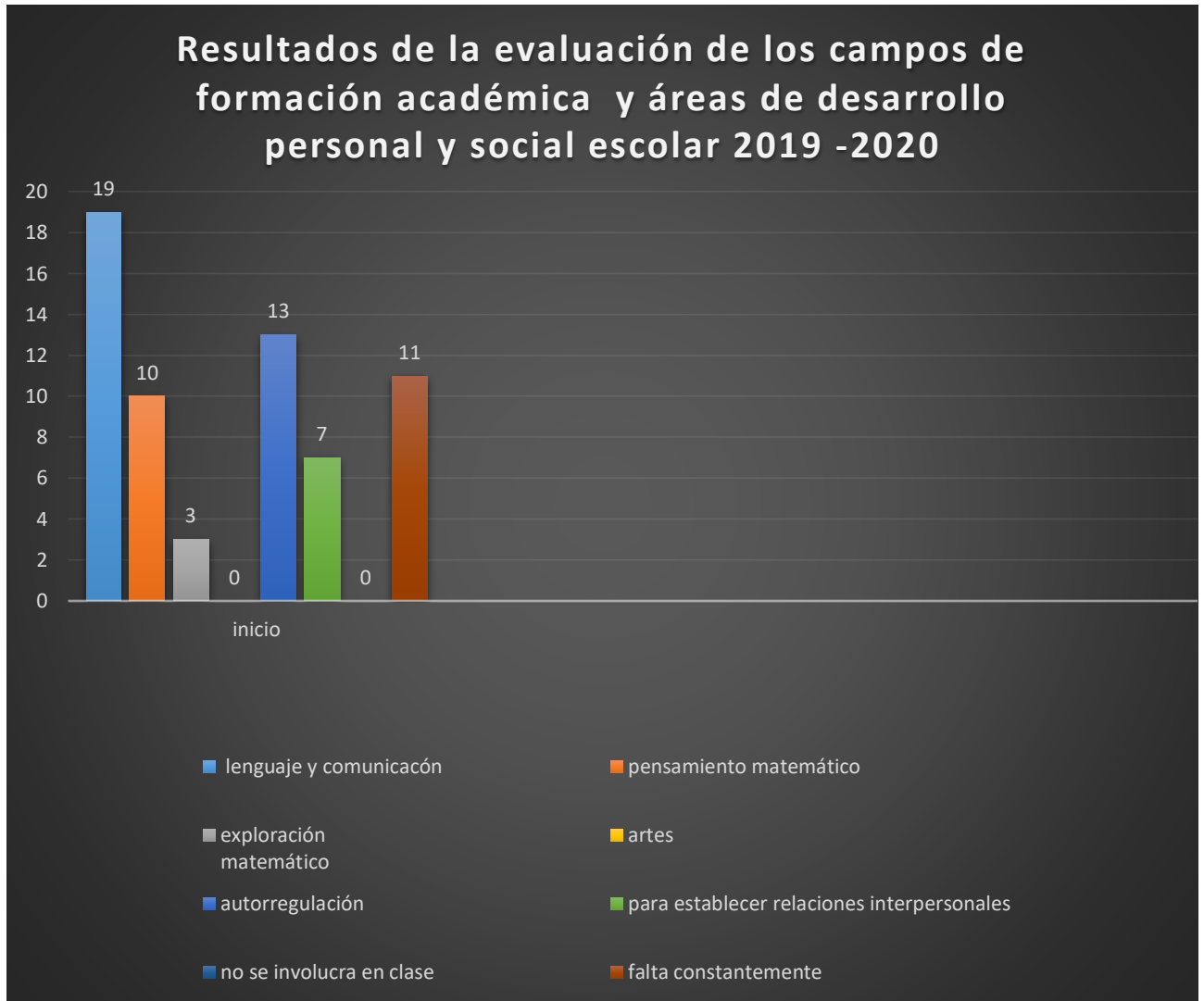
GRAFICA 1 Resultados de la evaluación de los campos de formación académica y áreas de desarrollo personal y social escolar 2019 -2020

A continuación se presenta los resultados obtenidos de la aplicación de los instrumentos.