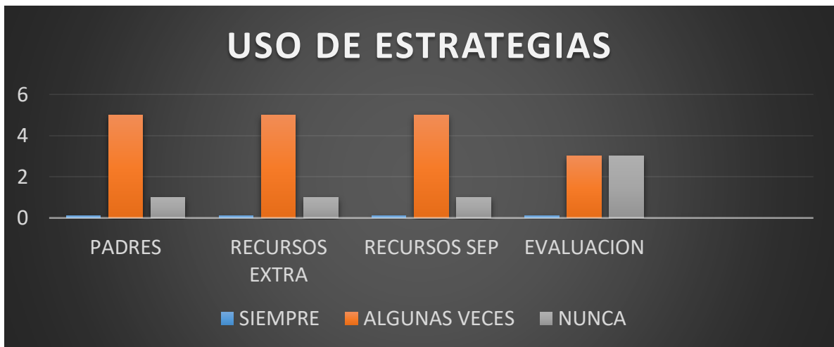
GRAFICA 3 RESULTADO DE CUESTIONARIO USO DE ESTRATEGIAS

Con base a los resultados obtenidos de la aplicación de los cuestionarios pasa saber sobre el uso de las estrategias docentes los recursos que emplea, así como la participación de los padres de familia y la evaluación de las estrategias que utilizan.