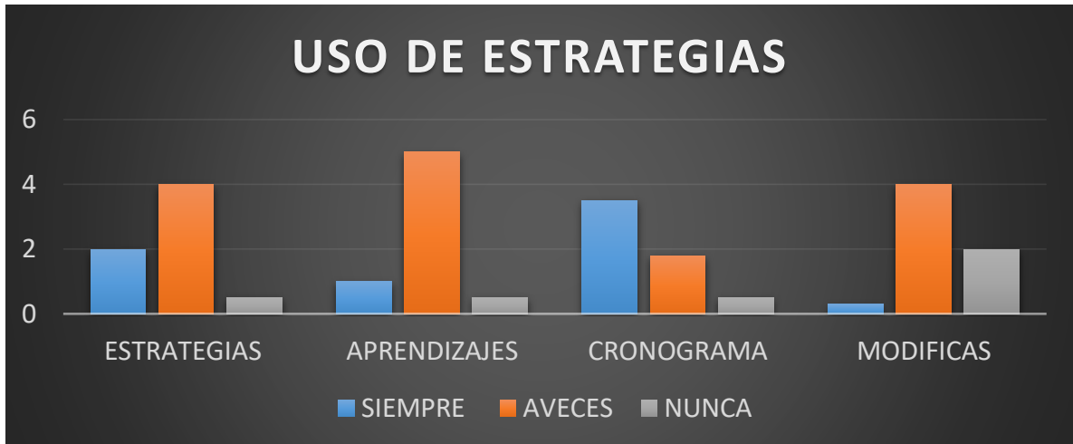
GRAFICA 2 RESULTADO DE CUESTIONARIO USO DE ESTRATEGIAS