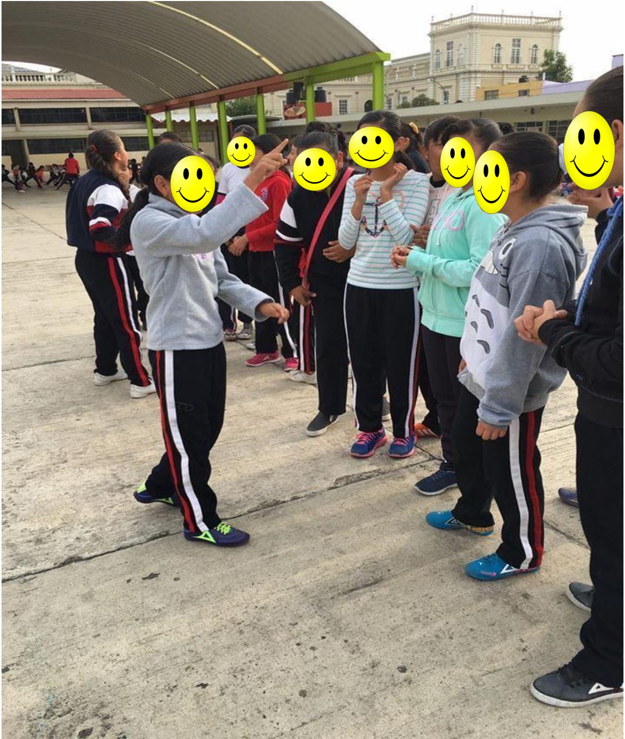
Los alumnos toman una ficha y regresaban a sus equipos para representar lo escrito con mímica.