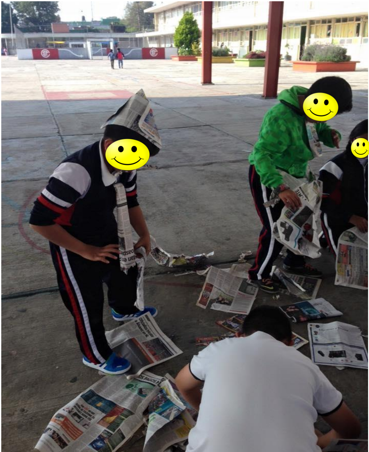
Con el uso del periódico los alumnos elaboran su vestuario y a su vez lo representan sin utilizar la voz.