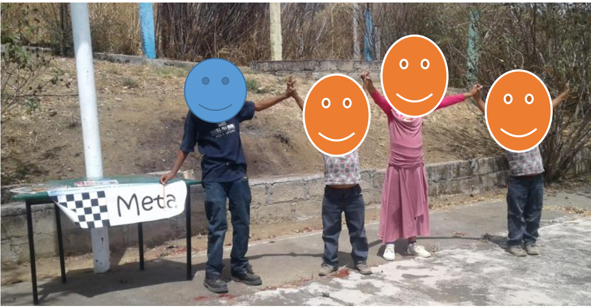
Termino con el rally con mucho éxito