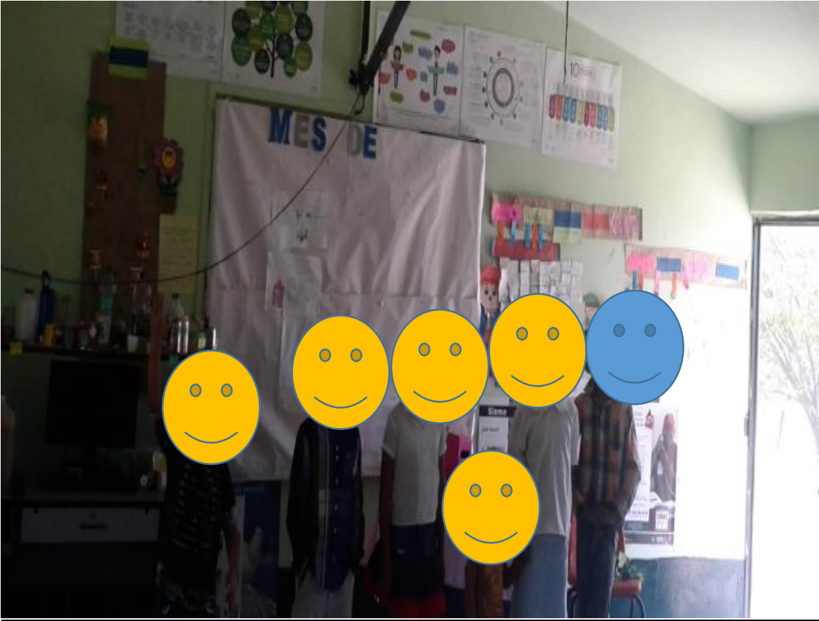
Declaman una poesía todos los alumnos