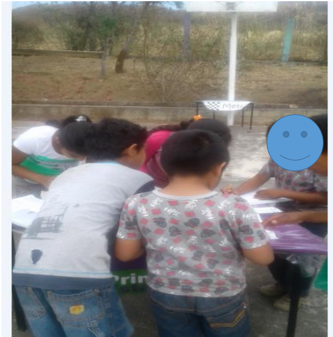
Participan en el rally, el alumno motivo de estudio, hizo equipo con dos de primer grado, fue un reto para él pero lo logro, teniendo paciencia y así terminar con el reto.