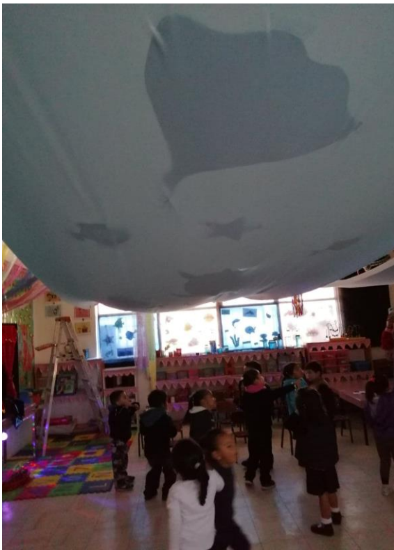
Ambientación de un acuario