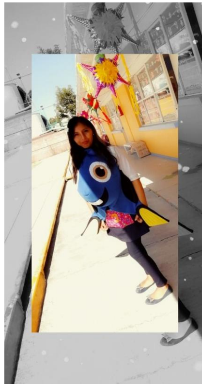
Preparada para contar el cuento "Mi Amigo el Pez"