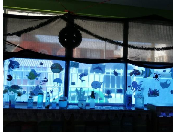
Creación de una pecera en el aula con imágenes que aportaron los niños