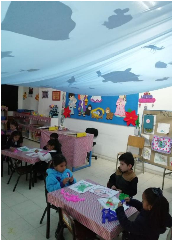
Uso de la técnica de boleado para decorar un animal acuático