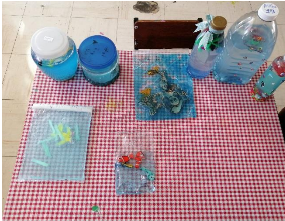
Acuario sensorial realizado por los niños