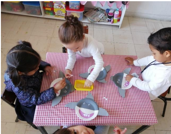
Creación de un tiburón haciendo uso del conteo (principio de conteo correspondencia uno a uno)