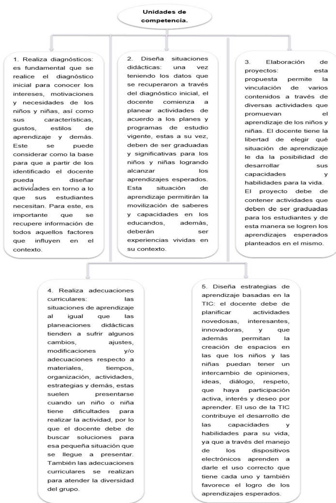
Figura 4. Esquema del progreso de cada unidad de competencia que da muestra del descubrimiento que se tuvo en cuanto a su gradualidad.