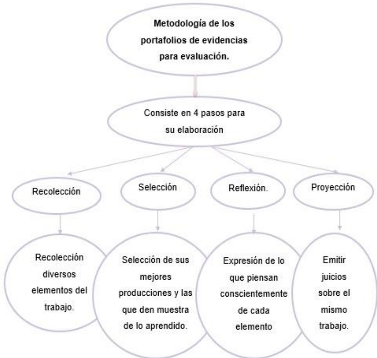
Figura 3. Metodología del portafolio de evidencias. En este esquema se pueden identificar de manera específica en que consiste cada uno de los 4 pasos de la metodología de Danielson y Abrutyn (2002) para la elaboración del portafolio de evidencias de evaluación.