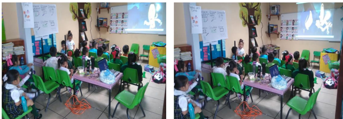
Arvizu, M. (2019). Función de la película “La leyenda de la llorona. [Fotografía].