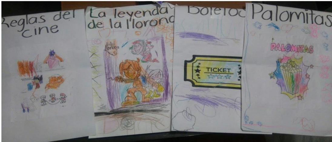
Arvizu, M. (2019). Elaboración de carteles para la difusión de la película. [Fotografía].