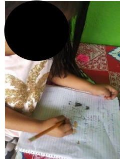
Figura 2. Descripción de imágenes.