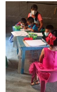
Figura 6. Visita domiciliaria.