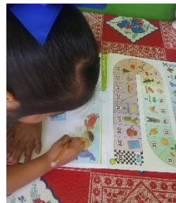
Figura 5. Avanza más y ganaras.