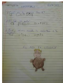
Figura 4. Emociones.