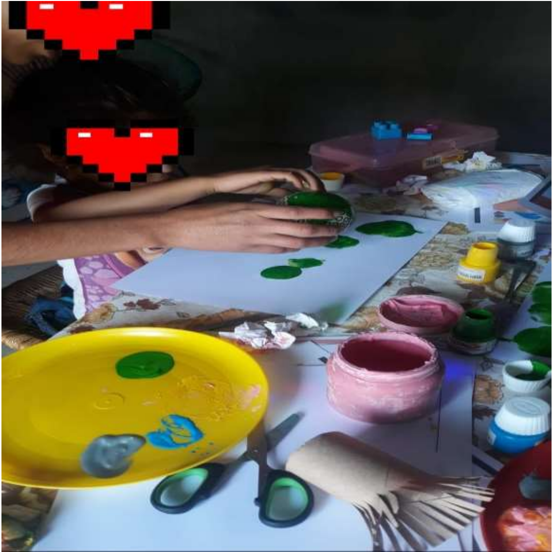
MADRE DE FAMILIA DANDO SUGERENCIAS A LA ALUMNA.