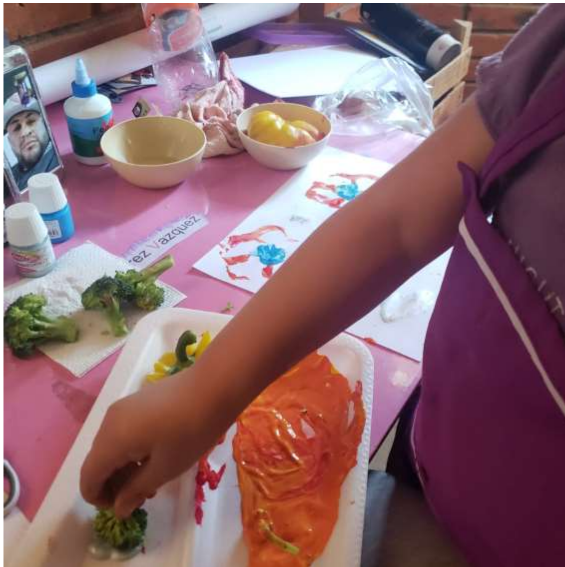
ALUMNA HACIENDO SUS MEZCLAS USANDO UN VEGETAL