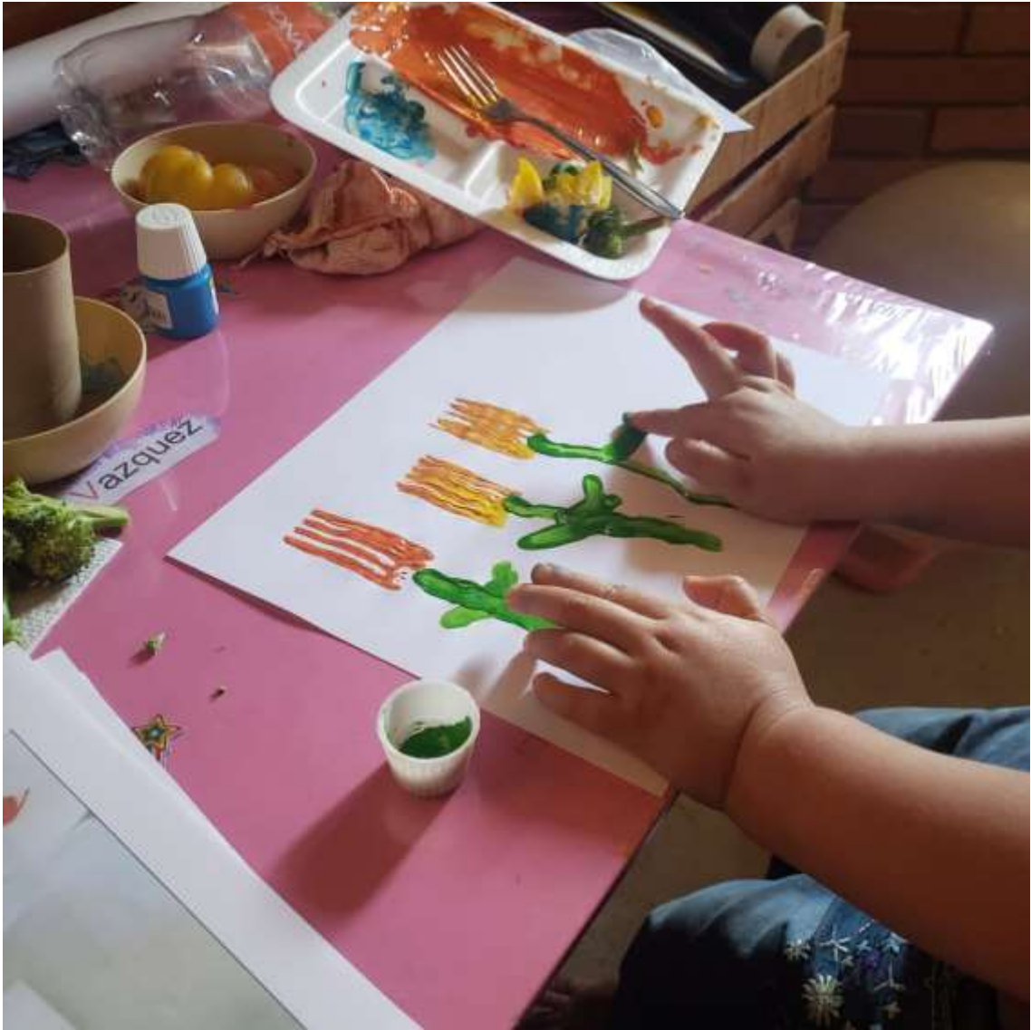
MEZCLANDO EL COLOR