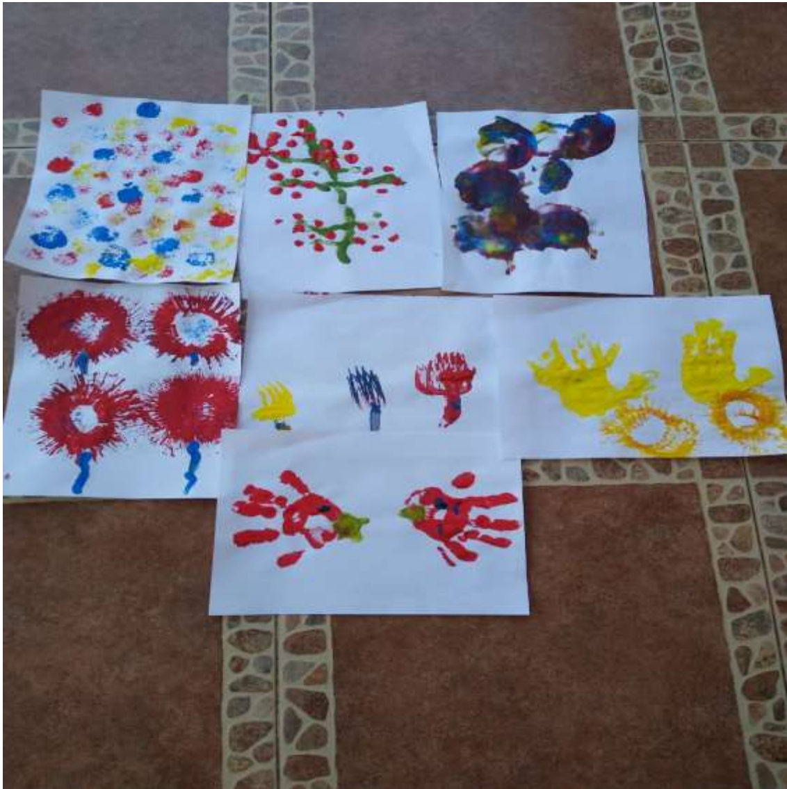
EXPOSICIÓN DEL ÁLBUM DESPUES DE MEZCLAR LOS COLORES.

Para calumniar con su actividad de los niños y sus mamás montaron más sencillas exposiciones de sus ceraciones , formando así su “Álbum de color” observando en estas , diferencias , estilos y su imaginación , su atención , creatividad entre otros.