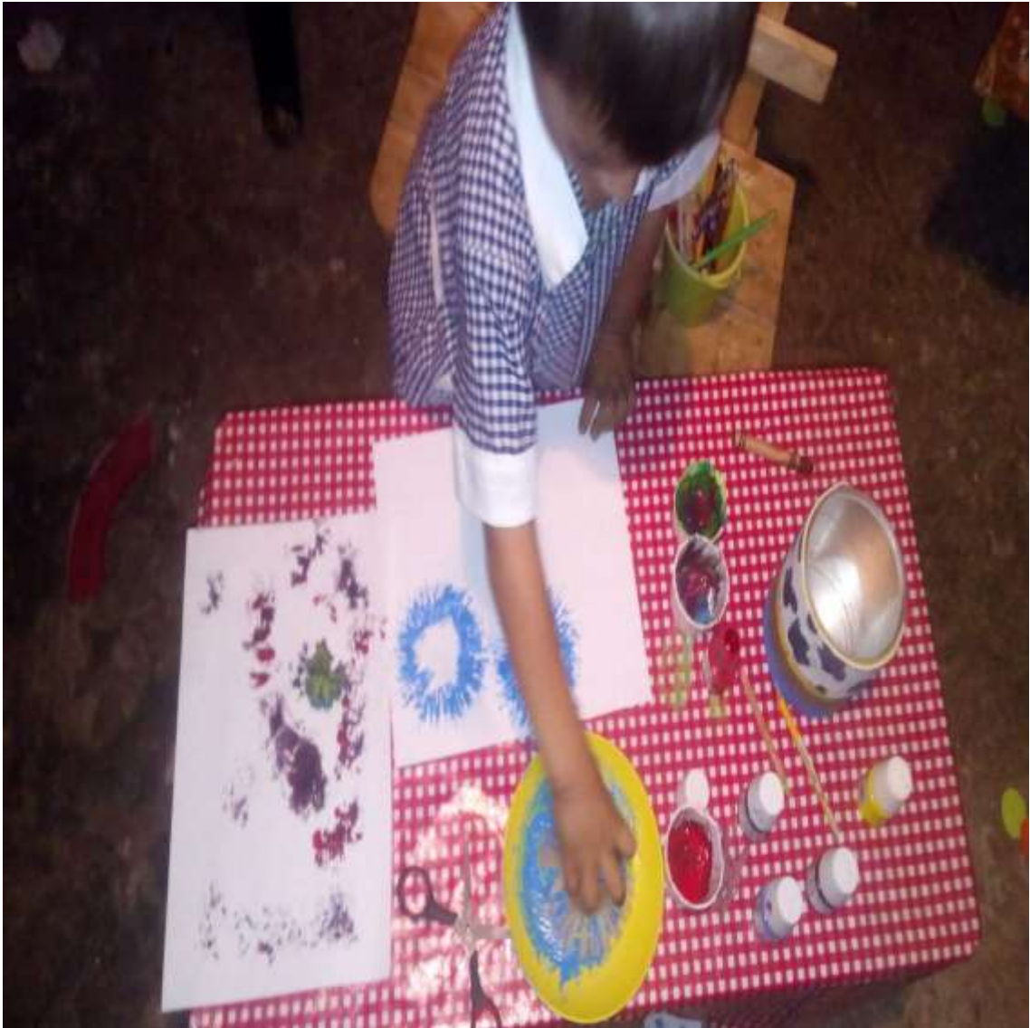
MEZCLANDO EL COLOR