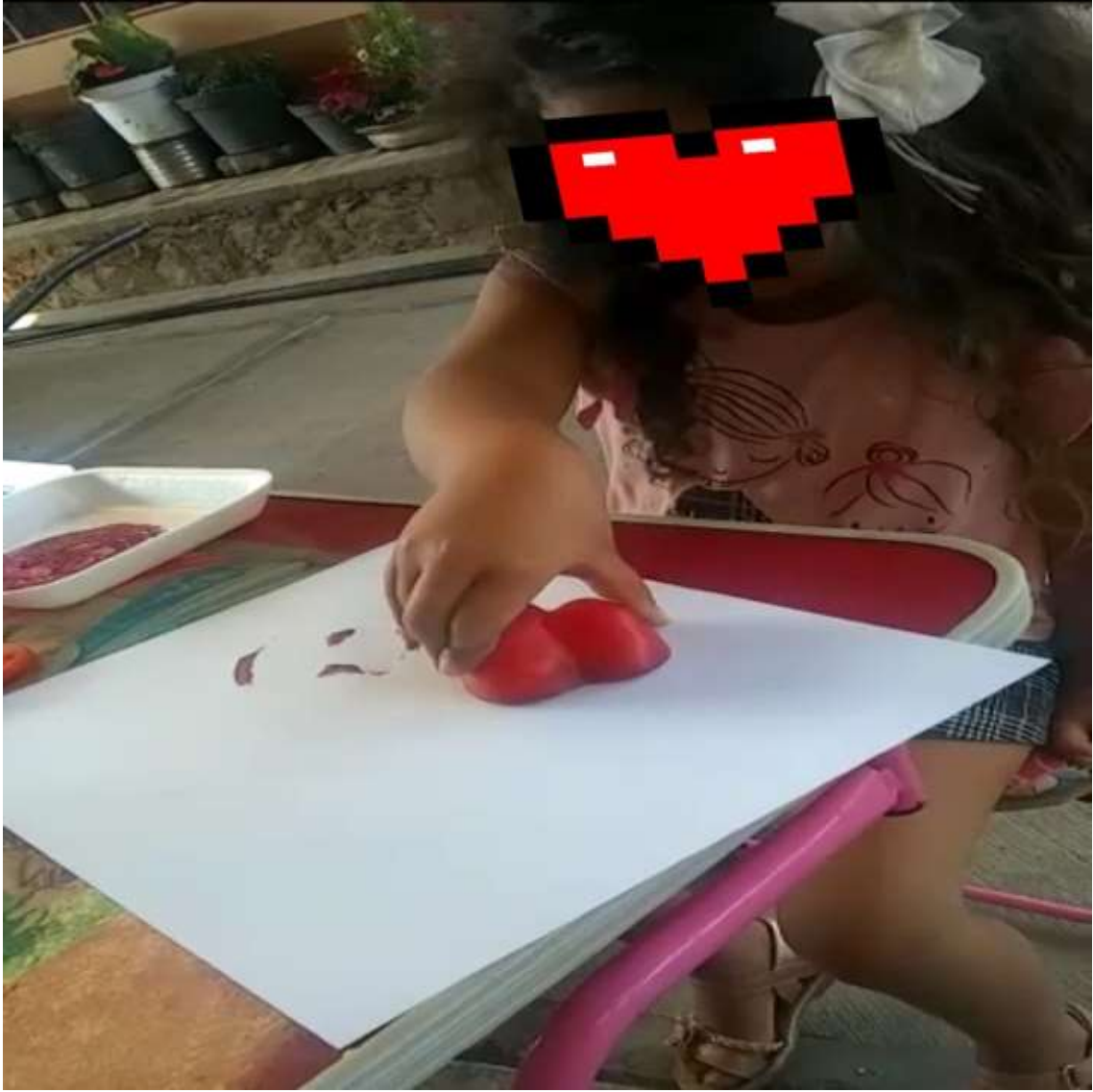
PRUEBA DE COLOR CON UN VEGETAL.