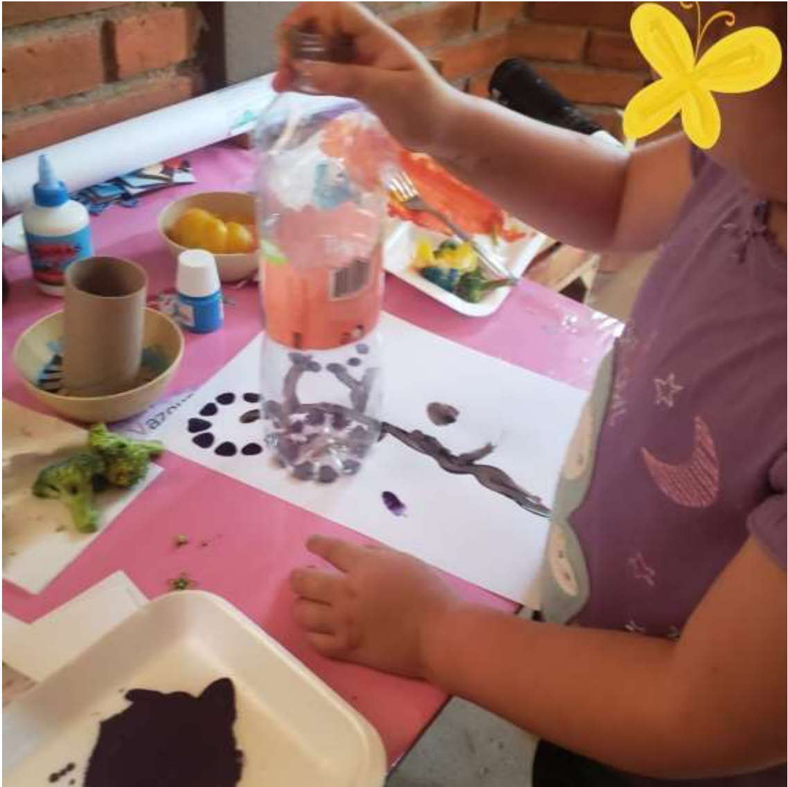
USANDO DIVERSOS OBJETOS Y CREANDO CON LA PINTURA.