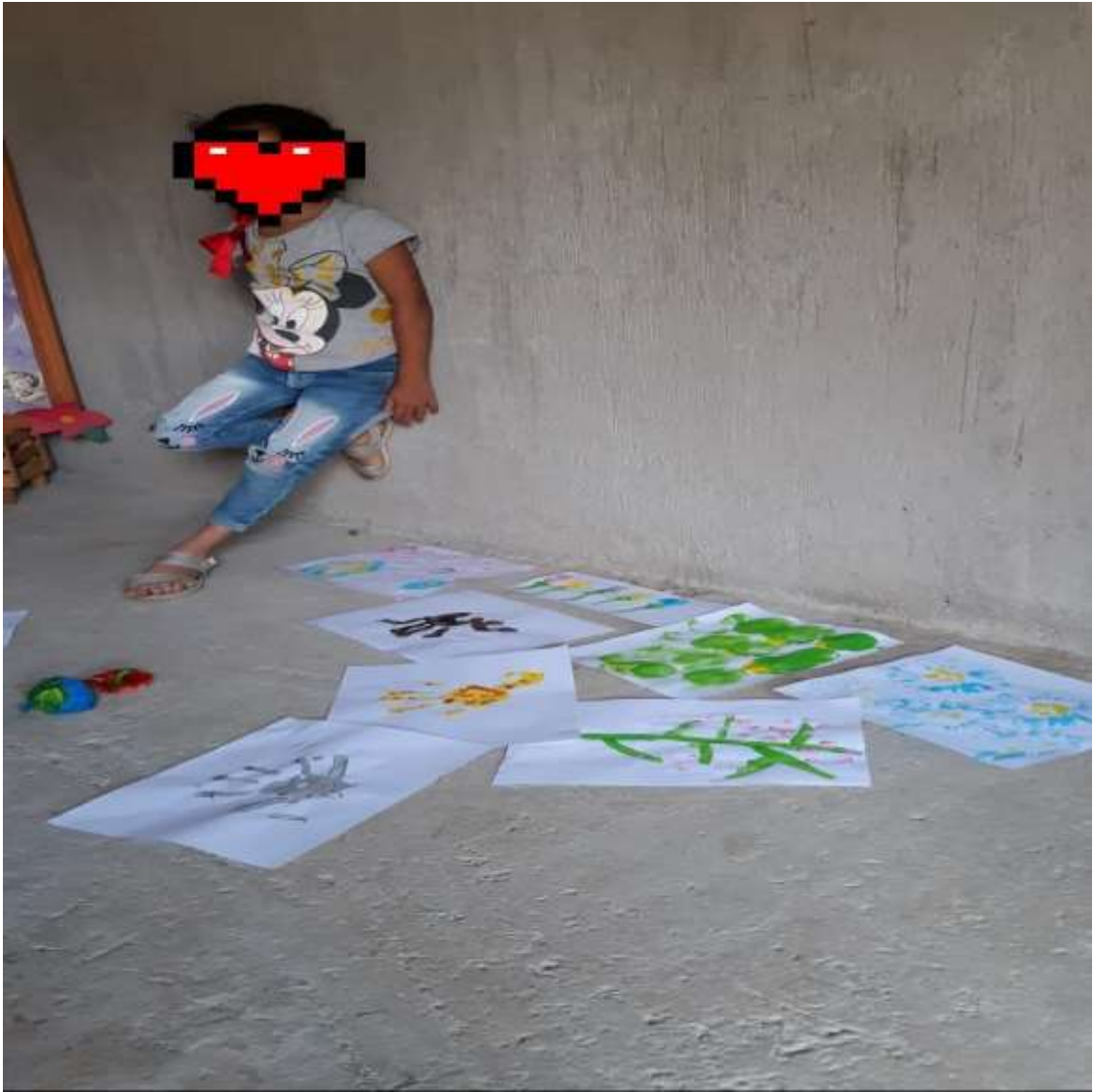
RESULTADOS OBTENIDOS AL MEZCLAR COLORES