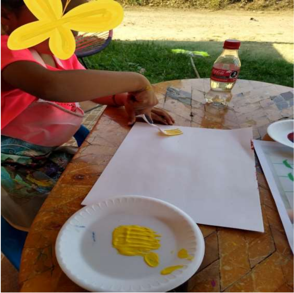
ALUMNA HACIENDO PRUEBAS DEL COLOR ELEGIDO POR ELLA.