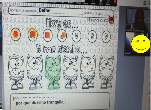
Evidencias de trabajo, enseñanza virtual, el moustro de las emociones

SECRETARÍA DE EDUCACIÓN SUBSECRETARÍA DE EDUCACIÓN BÁSICA DIRECCIÓN DE COORDINACIÓN REGIONAL DE EDUCACIÓN BÁSICA SUBDIRECCIÓN REGIONAL DE EDUCACIÓN BÁSICA METEPEC ZONA ESCOLAR J181 JARDÍN DE NIÑOS "ROSARIO CASTELLANOS"