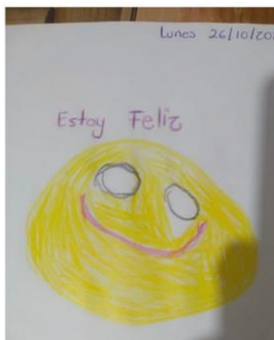
Evidencia de trabajo, emoción que sienten

Se les contó a los niños el cuento de “El monstruo de colores” y se realizaron preguntas para saber cómo se sentían ese día y por qué, después ellos asociaron el monstruo del color que representa esa emoción y realizaron un dibujo para representarlo, logrando que expresaran 8 niños el por qué se sentían así.