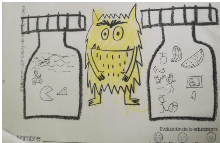
Evidencia de trabajo, el moustro de las emociones

SECRETARÍA DE EDUCACIÓN SUBSECRETARÍA DE EDUCACIÓN BÁSICA DIRECCIÓN DE COORDINACIÓN REGIONAL DE EDUCACIÓN BÁSICA SUBDIRECCIÓN REGIONAL DE EDUCACIÓN BÁSICA METEPEC ZONA ESCOLAR J181 JARDÍN DE NIÑOS “ROSARIO CASTELLANOS”