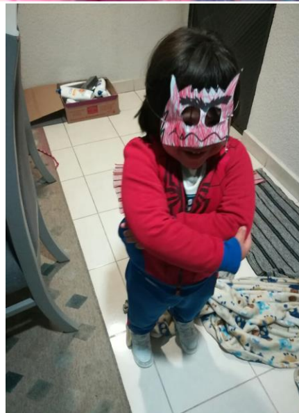
Evidencia de trabajo, caracterización del moustro de las emociones