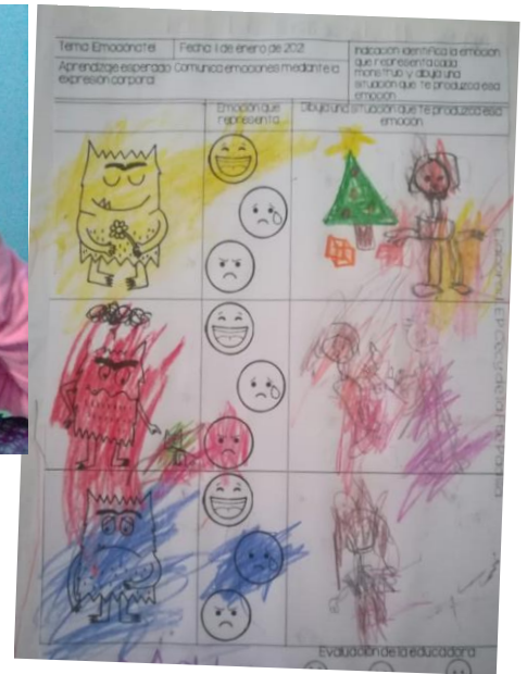
Evidencia de trabajo, el moustro de las emociones