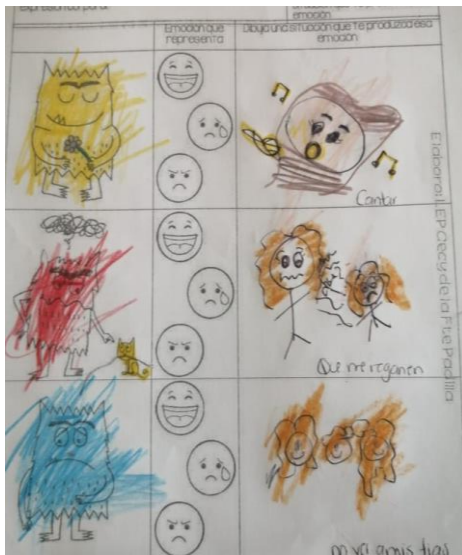
Evidencia de trabajo, el moustro de las emociones

Al realizar la siguiente actividad los alumnos identificaron y representaron las diferentes emociones utilizando una máscara que colorearon de acuerdo con el cuento del monstruo de colores y se la tenían que moler utilizando su cuerpo para dramatizar la emoción, posteriormente ellos identificaron en la hoja que emoción representaba cada monstruo y dibujarán que les hacía sentir la emoción.