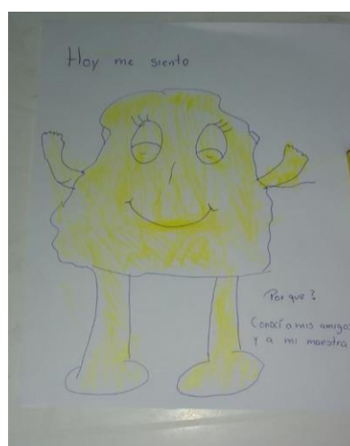
Evidencia de trabajo, emoción que sienten