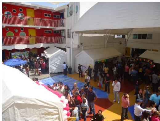
Figura 9. Castañeda, Gabriela. (30 de mayo, 2018) Panorámica del Happy-Day. [Fotografía] Recuperado de "Fotos de la biografía".

https://www.facebook.com/media/set/?vanity=HappyRogersMx&set=a.1760857650814020