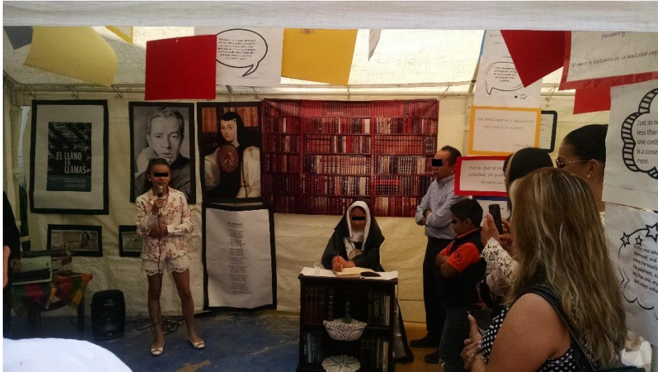
Figura 7. Castañeda, Gabriela. (30 de mayo, 2018) Stand Escritores 5ºA. [Fotografía] Recuperado de “Fotos de la biografía”.

https://www.facebook.com/media/set/?vanity=HappyRogersMx&set=a.1760857650814020