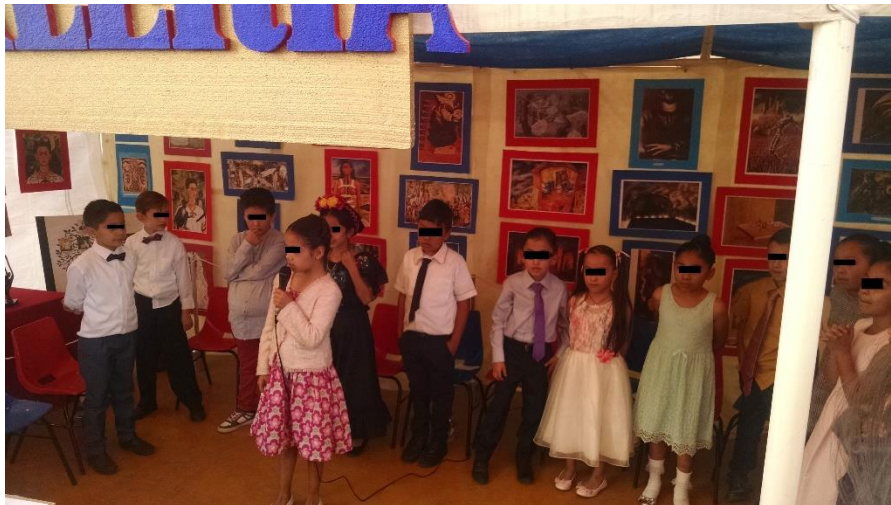
Figura 4. Stand Pintores 2°A. [Fotografía] Recuperado de “Fotos de la biografía”. https://www.facebook.com/media/set/?vanity=HappyRogersMx&set=a.1760857650814020