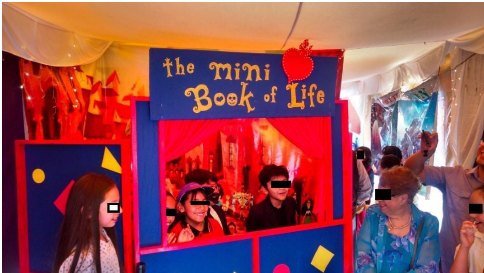
Figura 8. Stand Cineastas 5ºA.