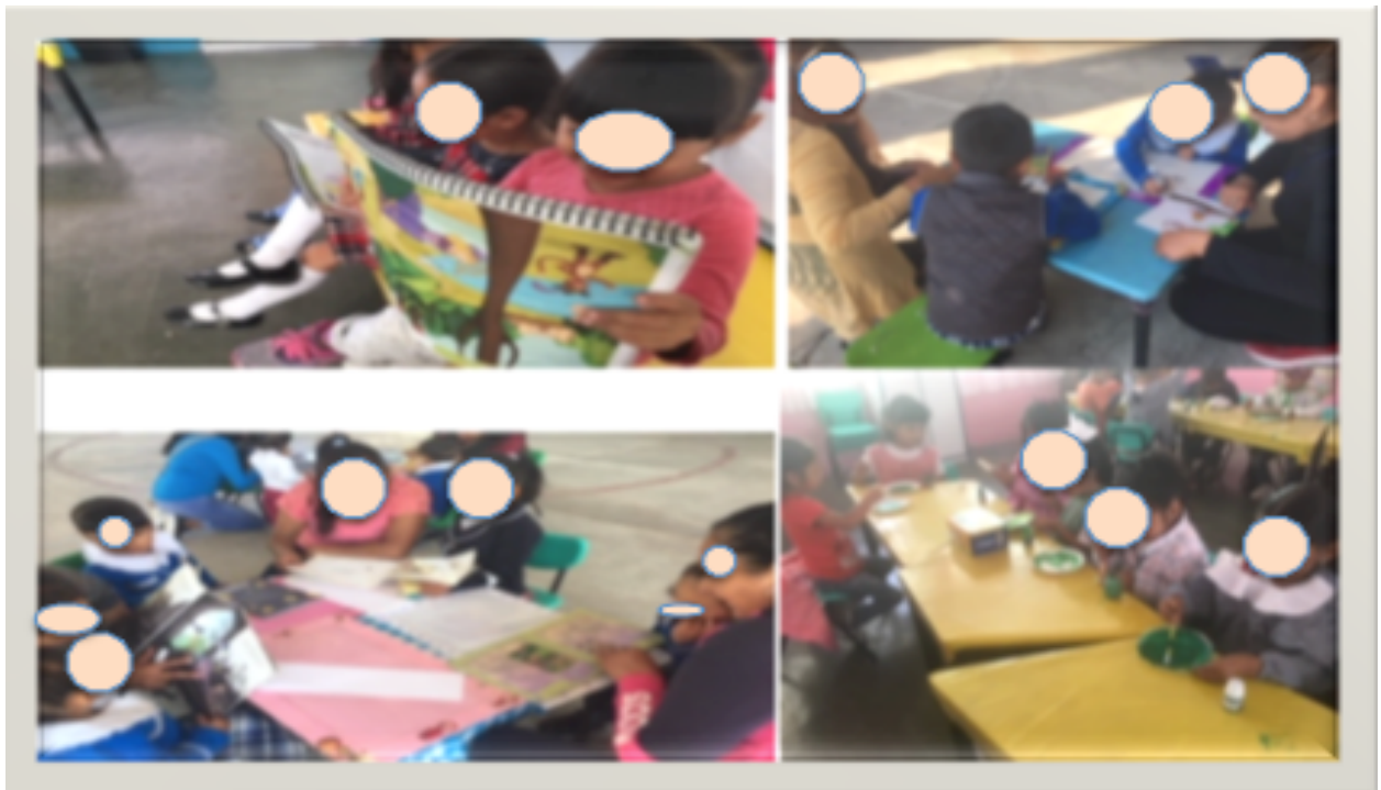
Evidencias de trabajo, exposición de arte