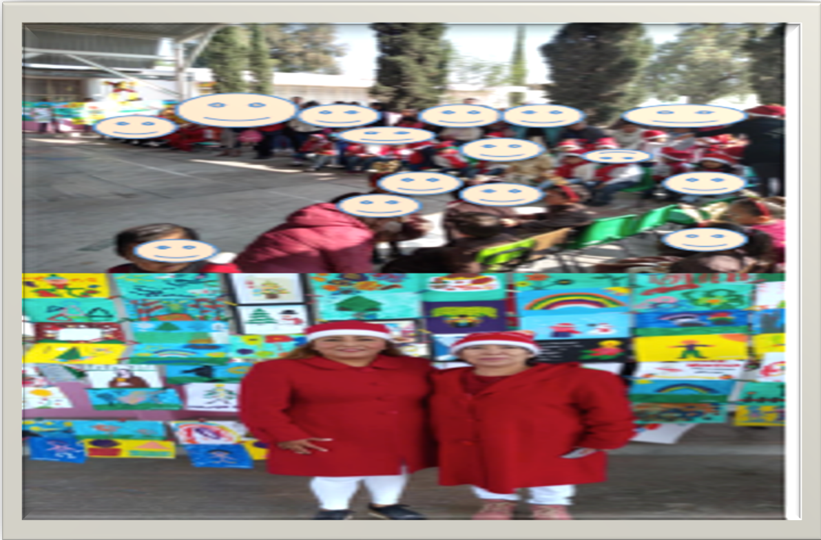
Evidencias de trabajo, exposición de arte