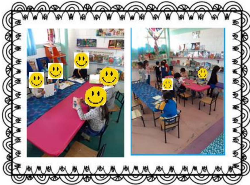
Exploración libre de alumnos en las diferentes espacios