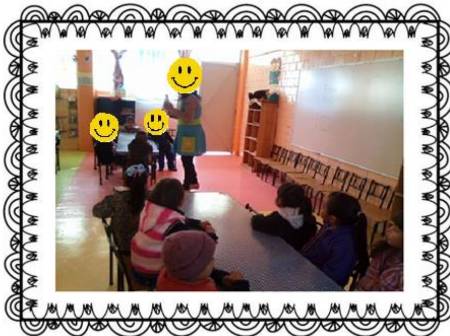
Los alumnos se observan sentados en las mesas para el trabajo de lectura de cuento.