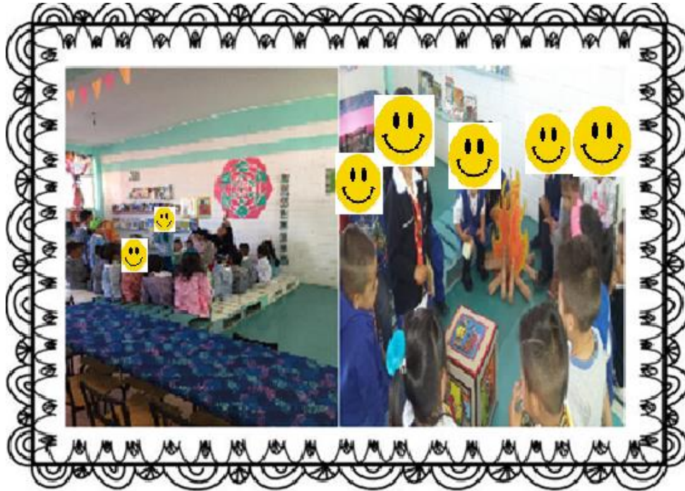
Alumnos de Segundo y Primer Grado creando historias mediante el uso de cubos lectores