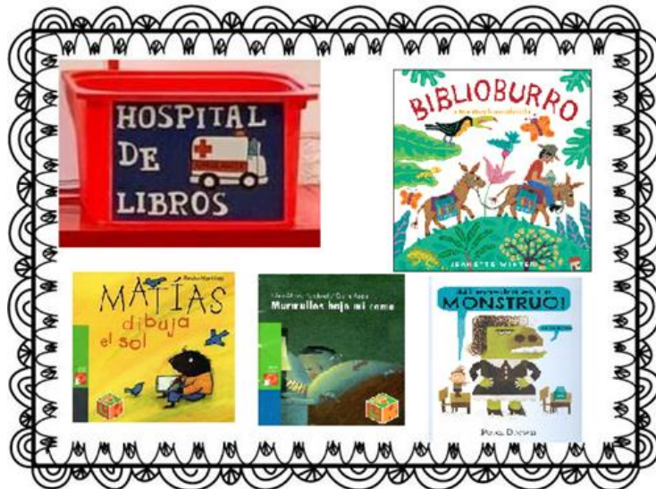
HOSPITAL DE LIBROS. Libros restaurados