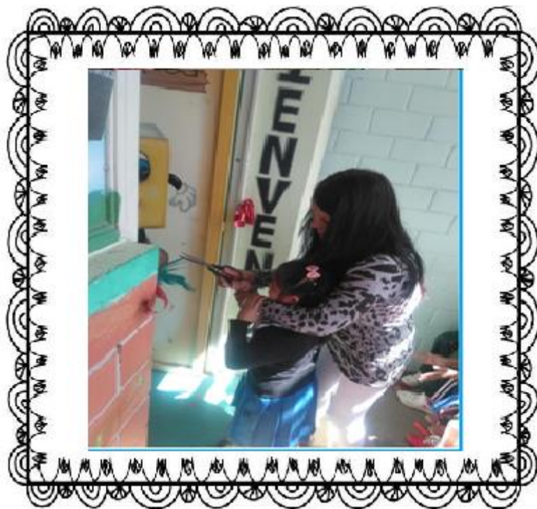
INAUGURACIÓN DE BIBLIOTECA. Madre de familia y alumna cortando listón