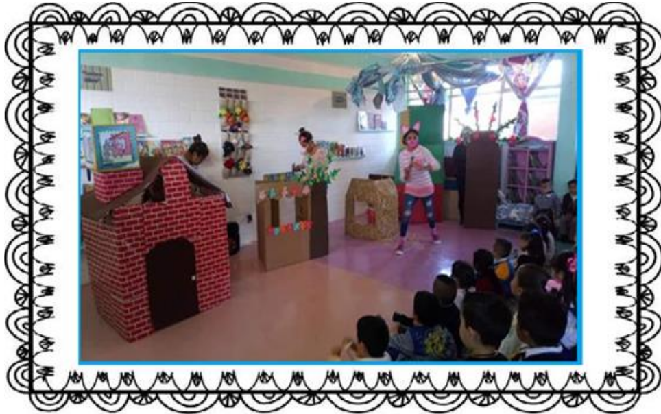
Comité de biblioteca realizando presentación de cuentos.

La participación de los padres de familia ha sido un gran apoyo para fortalecer en los alumnos el gusto por la lectura y el acercamiento a la escritura ya que al observar las obras los alumnos se emocionan y se interesan centrando su atención en los cuentos. Al finalizar la presentación los padres de familia invitan a los alumnos a asistir a la biblioteca para poder leer muchos libros de temas interesantes para ellos. Se despierta un interés en los niños y niñas por ir a explorar a la biblioteca los diferentes cuentos que hay y poder utilizar los espacios para disfrutar de la lectura libre o guiada.