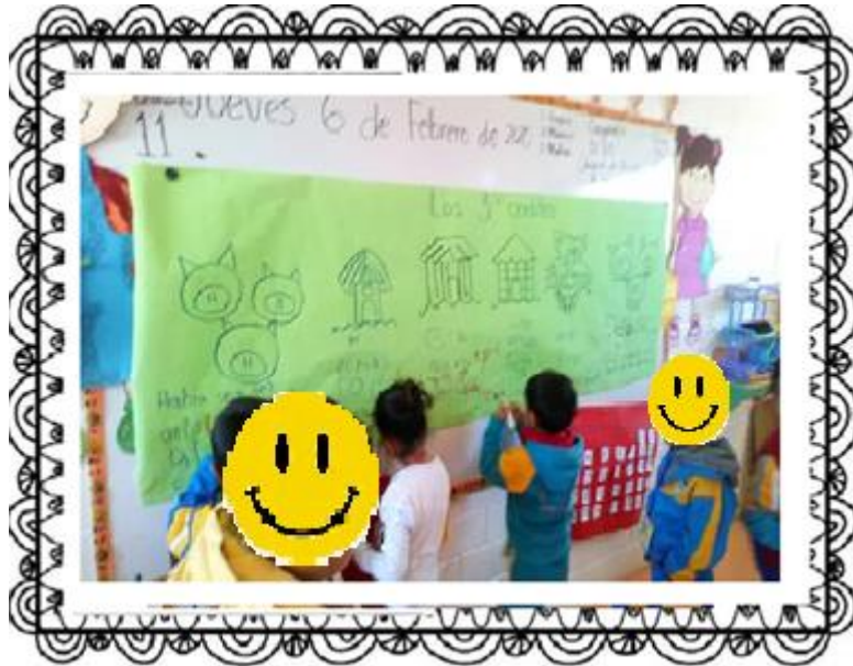
Producciones escritas de los alumnos retomando la representación de un cuento por comité de biblioteca.