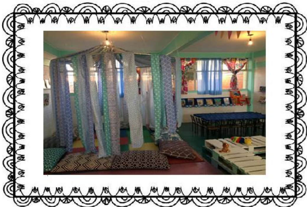
Cojines gigantes para tapete, aro con tela.