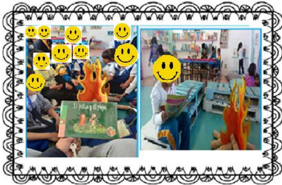
Alumnos leyendo o escuchando narración de cuentos.