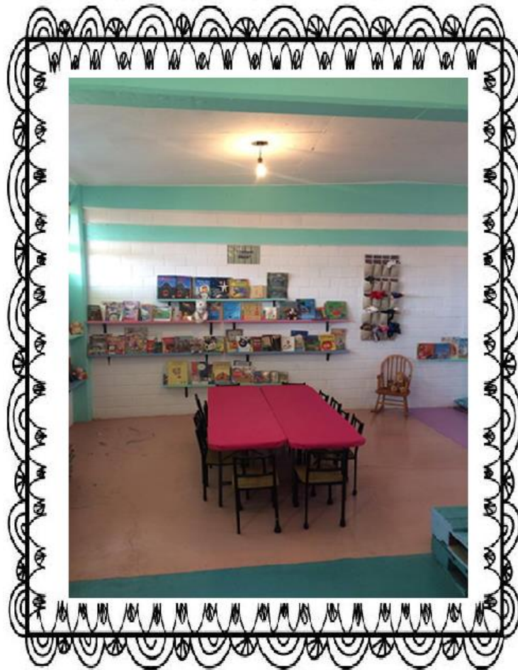
Repisas nuevas, guiñoles y títeres para lectura de cuentos.