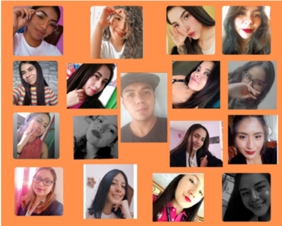
Alumnos de Primer año grupo 1 Licenciatura en Educación Primaria