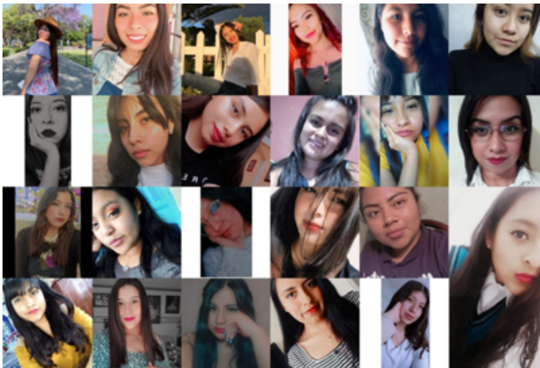
Alumnos de Primer año grupo 2 Licenciatura en Educación Primaria