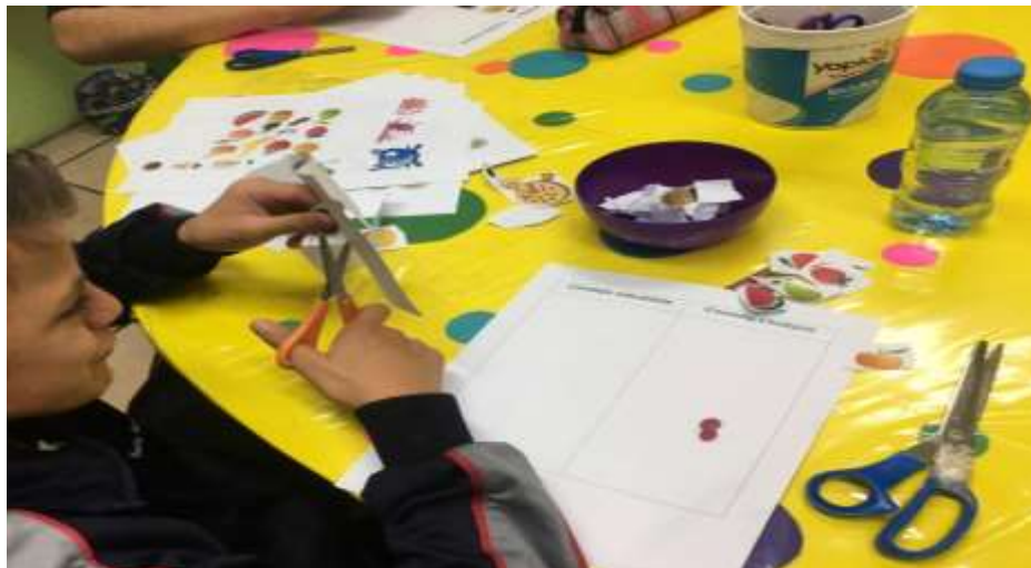
Figura 7. Habilidades prácticas: Conocimiento de comida sana y chatarra.