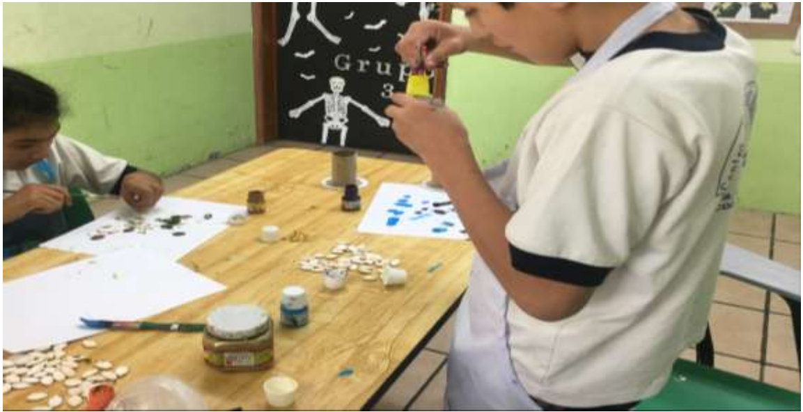
Figura 2. Para mejorar la caligrafía de la letras se llevaron a cabo actividades de motricidad fina como se muestra en la imagen en este caso fue la elaboración de una manualidad.