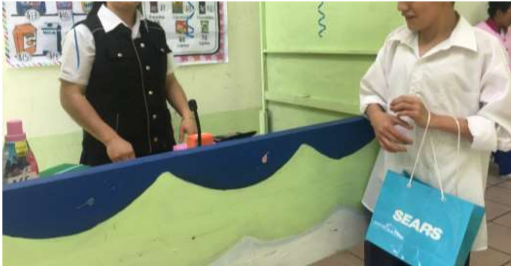
Figura 6. Habilidades conceptuales: Ejemplo de una de las actividades que se llevó acabo para poner en práctica los conocimientos antes vistos del manejo del dinero, en la cual los alumnos tenían que realizar compras con productos y precios reales utilizando solamente monedas de pequeño valor como lo fue de $1, $2 y $5.