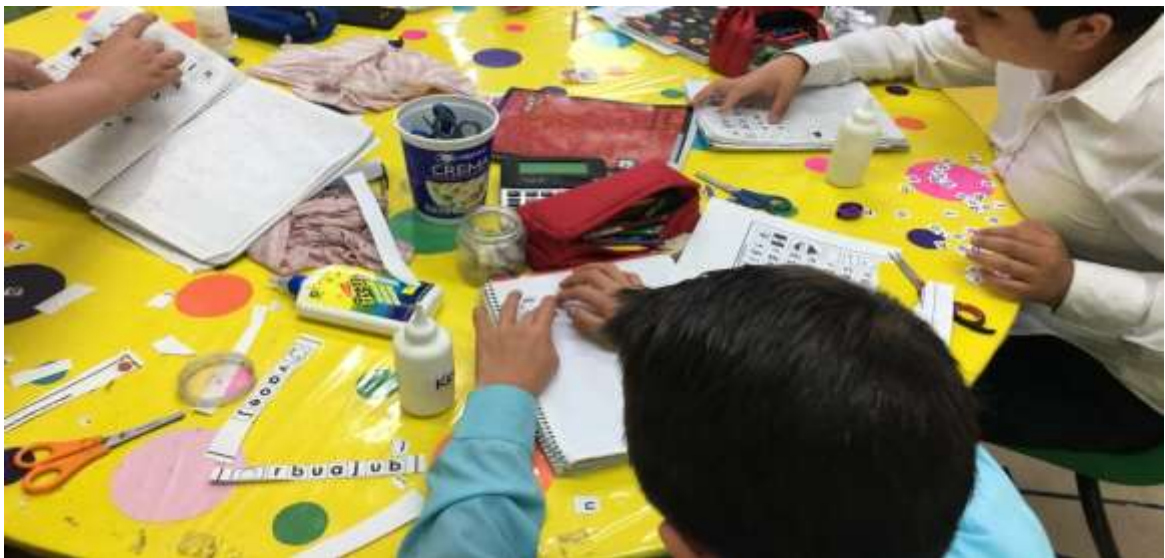
Figura 3. Para trabajar la escritura se realizaron ejercicios como el que se muestra en la imagen.