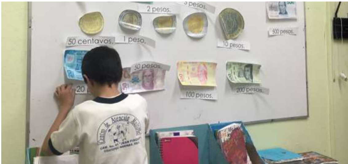
Figura 5. Habilidades conceptuales: En la imagen se puede observar la clasificación y conocimiento del valor de las monedas de uno de los sujetos que presenta discapacidad intelectual.