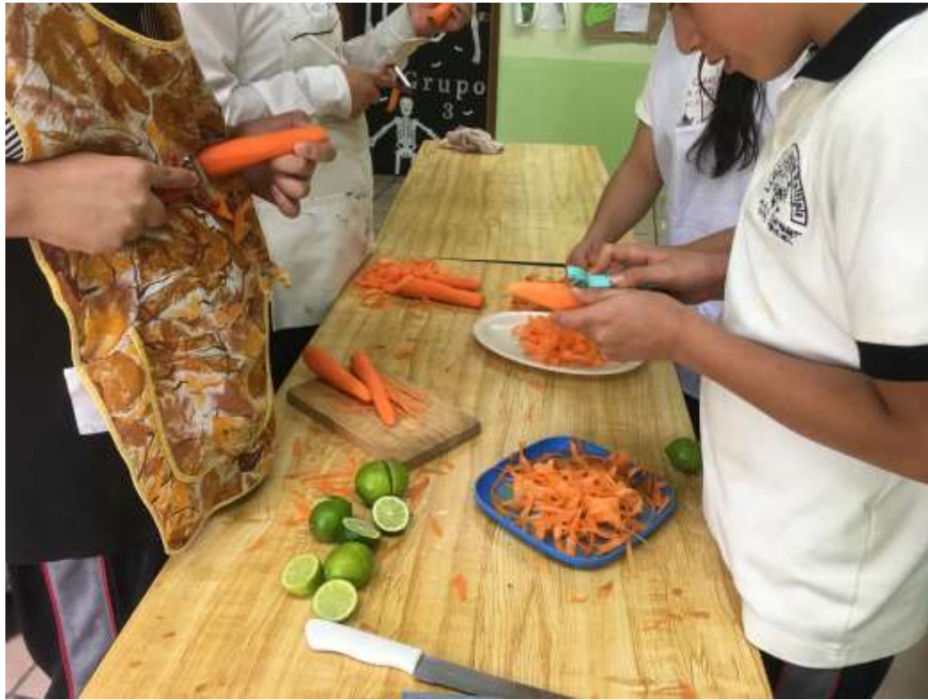
Figura 8. Habilidades prácticas: Preparación de alimentos.