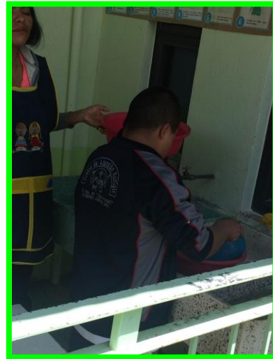
Anexo 4. El alumno muestra una autonomía para el lavado de trastes.