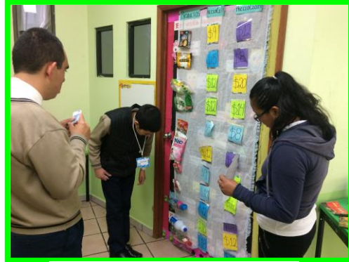
Anexo 2. Haciendo del dinero.