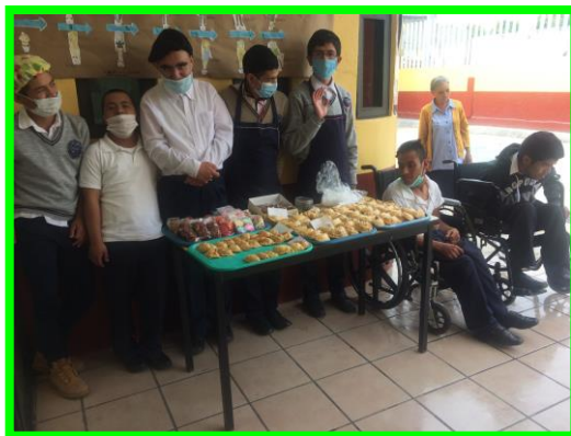
Anexo 7. Venta de productos, haciendo la utilización del dinero.