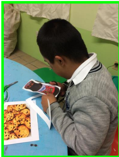
Anexo 3. Recortando imágenes relacionadas con la palabra.