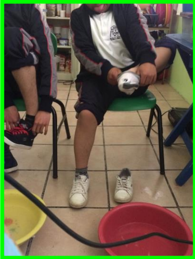
Anexo 5. El alumno muestra autonomía a la hora de vestirse.