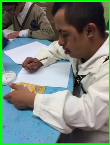
Anexo 1. Identificando las letras de su nombre en los productos.