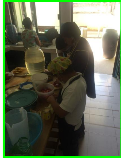
Anexo 6. Utilización de insumos para la realización de productos para vender.