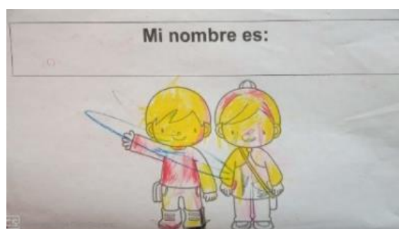
Imagen 1 y 2 “Mi nombre es importante”. Trabajos realizados por estudiantes del grupo 3ro. “A” acorde a la actividad “Escritura de su nombre en una hoja diagnostica”. Jardín de Niños “Carlos Mérida” (02/09/2019)