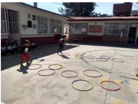
Imagen 10 “Circuito de acción motriz”. Clase de educación física en donde los estudiantes ponen en práctica sus habilidades motrices y cognitivas. Jardín de Niños “Carlos Mérida” (11/09/2019)

La actividad del circuito de acción motriz para encontrar mi nombre (Imagen 10) consistía en que los estudiantes a partir de estaciones de trabajo de forma secuencial que requirieran poner en práctica sus habilidades motrices, fuese una oportunidad para identificar qué alumnos iban avanzando en el logro del aprendizaje, debido a que al finalizar el circuito se encontraban todas las tarjetas con el nombre o los nombres de cada estudiante y ellos tenían que identificar cuál era el que les correspondía, esta actividad me permitió comprobar que la educación física no es un área aislada en mi práctica, sino que forma parte del desarrollo integral de los estudiantes.