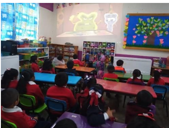
Imagen 11” Proyección de video acerca de las medidas de higiene para prevenir enfermedades”. En la fotografía se muestra que se le esta dando a conocer a los estudiantes la problemática de salud por la que se enfrenta el país. Jardín de Niños “Carlos Mérida” (02/03/2020)

(Anexo 3) con las cuales se tenía la intención de orientar a los estudiantes acerca de los síntomas que presenta una persona que tiene una enfermedad respiratoria y la importancia de hacerle saber a su tutor cuando ellos se sienten mal para que los puedan llevar con un médico y tratar la enfermedad de manera profesional, también se les colocaron videos informativos en los que se trataban temas de salud e higiene, por ejemplo, la manera correcta de estornudar y el lavado de manos, (Imagen 11) al inicio del ciclo escolar ya se había trabajado con los estudiantes acerca de las medidas del cuidado personal, pero la enfermedad al ser una situación de extrema atención se dio un repaso.