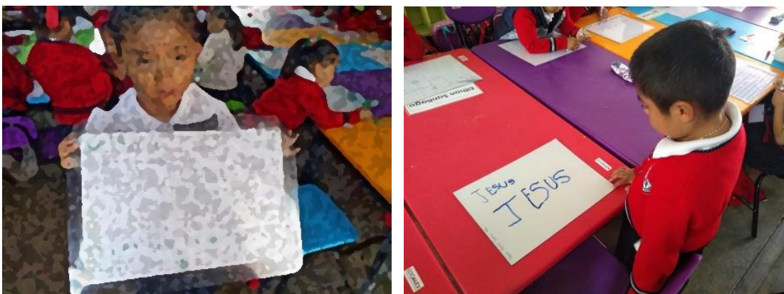
Imagen 5 y 6 “Pizarrón mágico”. Primer día utilizando pizarrón mágico para la escritura del nombre propio. Jardín de Niños “Carlos Mérida” (09/09/2019)

Al día siguiente la actividad constaba en hacer la escritura de su nombre pero ahora en un espacio más reducido y con otro tipo de materiales para que ellos fueran practicando sin que fuese repetitiva la actividad, se solicitó a los padres con tiempo de anticipación el material, el cual era algo novedoso para los alumnos ya que lo denominamos pizarrón mágico, (Imagen 5 y 6) esto fue un estímulo porque cada uno tenía su propio pizarrón, marcadores y un trapo para que tuvieran la posibilidad de borrar con facilidad e intentar las veces que consideraran necesarias, por un lado el pizarrón es blanco y por el otro tiene cuadrícula, ellos decidían el espacio en el que se sentían más seguros de escribir a partir del tamaño de sus letras.