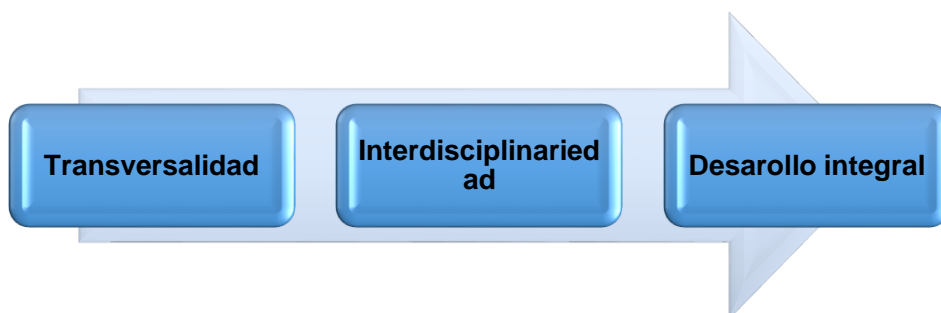
Figura 3 “Correlación de conceptos fundamentales de la investigación”. El esquema permite vislumbrar los conceptos fundamentales para la comprensión del tema de investigación.

Al iniciar la investigación se tenía una idea muy general de lo que conlleva la transversalidad del currículo y el desarrollo integral de los estudiantes, al revisar a mayor profundidad las características y la intención que tienen los proyectos transversales, se logró hacer una correlación (Figura 3) en la cual se reconoce un concepto fundamental que me permitió tener claridad de las implicaciones del tema que me encontraba investigando, para posteriormente ponerlo en práctica con los estudiantes a los que atendía en mis prácticas profesionales, dándome insumos para estudiar y concretar la competencia profesional que debía fortalecer.