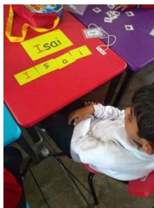
Imagen 3 y 4 “Rompecabezas de mi nombre”. En las imágenes dan muestra del material que se utilizó para la actividad. Jardín de Niños “Carlos Mérida” (04/09/2019)