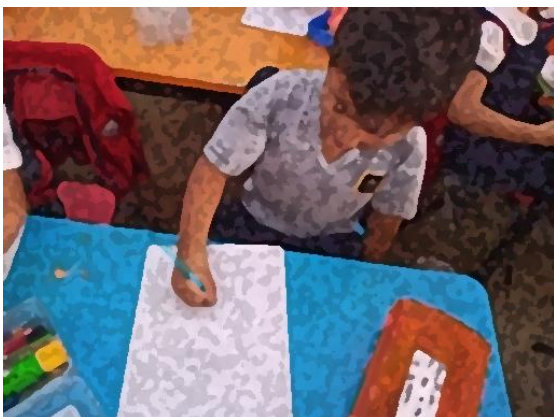
Imagen 12 “Cartel de medidas de higiene para mantenernos a salvo”. Los estudiantes a partir de su creatividad elaboraron carteles informativos. Jardín de Niños “Carlos Mérida” (02/03/2020)

Conforme los medios de comunicación daban a conocer que los espacios en los que se reuniera una cantidad de personas de manera masiva eran consideradas zonas de riesgo, las medidas que tomaban las escuelas aumentaban a partir de las indicaciones oficiales en materia de salud pública, una de ellas, fue el llenado de un formato en el que los tutores de los niños y niñas debían responder si en los últimos días ellos o una persona cercana recientemente había salido del país, si habían presentado alguno de los síntomas que las autoridades del sector salud anunciaban, entre otras preguntas.