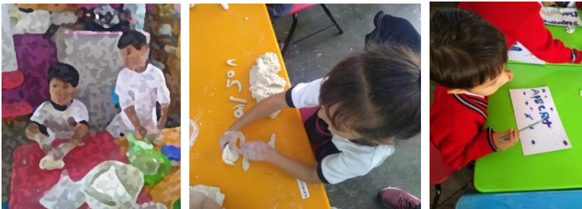
Imagen 7, 8 y 9 “Mi nombre con masa de sal”. Los pasos que los niños y niñas hicieron para culminar con la escultura de su nombre propio. Jardín de Niños “Carlos Mérida” (10/09/2019)