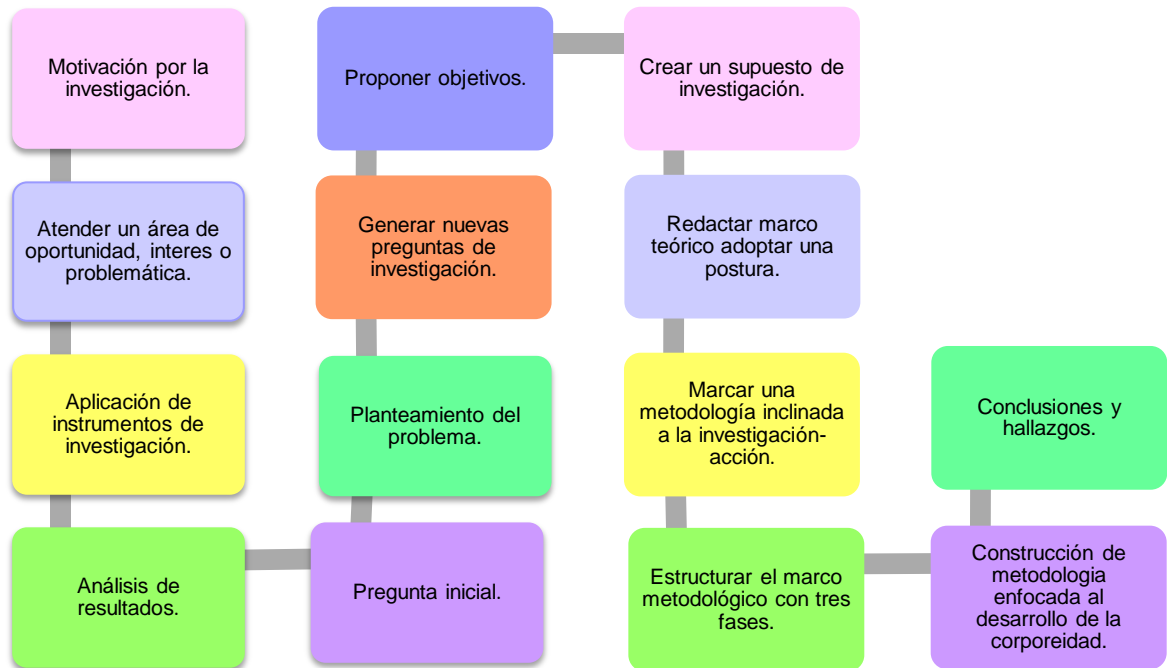
Figura 2: Ruta metodológica. En ella se ve edificada el proceso de investigación, a partir de todo el sustento que se maneja en esta tesis. Elaboración propia.

La ruta metodológica construida a partir del inicio de la investigación en el sexto semestre refleja dicho procedimiento de investigación-acción, buscando alternativas de explicación a una problemática identificada, respecto al dominio pedagógico de un área de desarrollo personal y social que forja la consciencia de la corporeidad y que actualmente es fundamental revisar, estudiar, conocer y comprender las bases teóricas en las que se sustenta esta educación de formación integral.