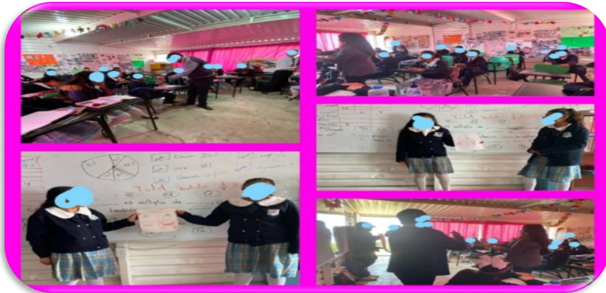
Figura 1. Muestras de exposiciones realizadas en el aula