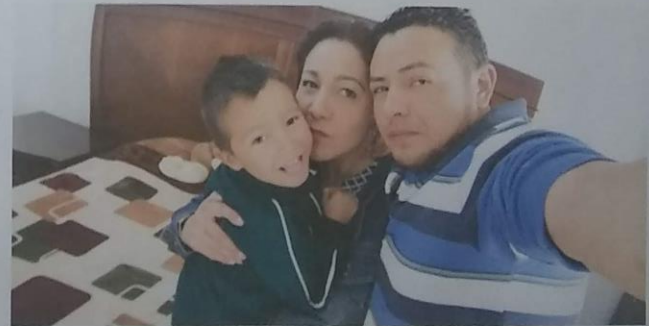
Ilustración 7 Familia de Baruk poniendo en práctica valores dentro de su contexto familiar