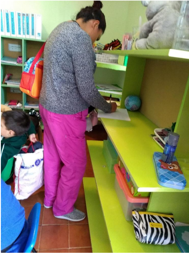
Ilustración 1 Madre de familia apoyando en actividades para sus hijos