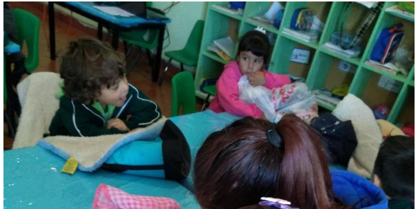
Ilustración 2 Madre de familia contestando una entrevista para una actividad dentro del aula.