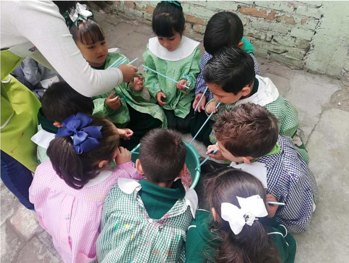
Ilustración 9 Equipo rojo trabajando en equipo elaborando sus burbujas para crear sus hojas decoradas y poder venderlas