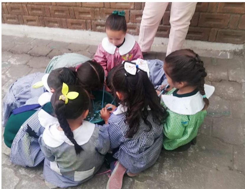
Ilustración 10 Equipo verde trabajando en equipo utilizando como estrategia tomar turnos para poder elaborar sus burbujas