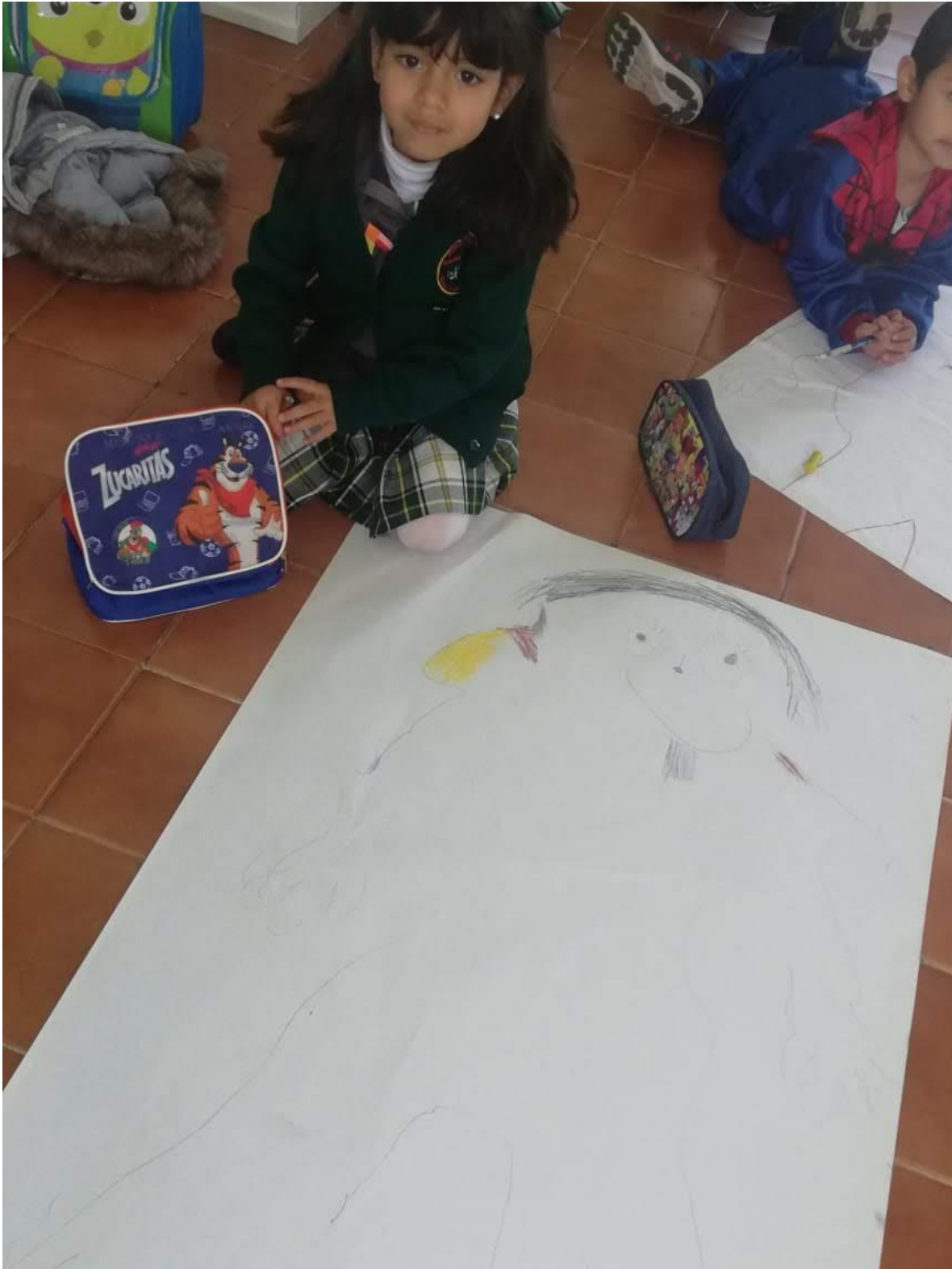
Ilustración 14 Representación de la actividad ¿Quién Soy