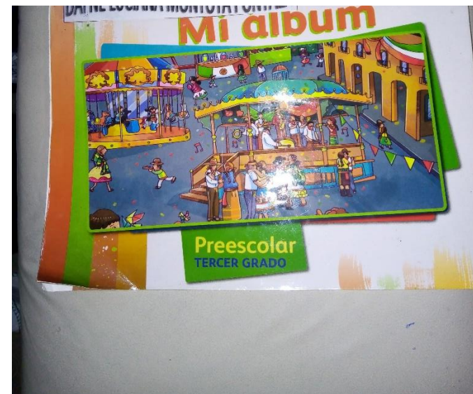
Mi album, fotografía original