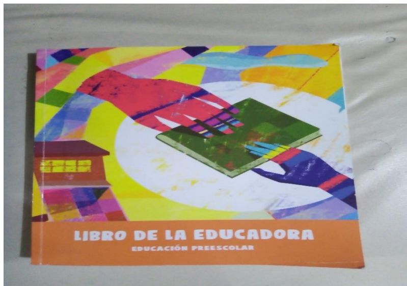
Libro de la educadora, fotografía original

Se busca que se movilicen las capacidades y las habilidades que poseen cada uno de los niños y niñas del Preescolar, con ciertas finalidades y versiones de acuerdo al grado de complejidad y a las características de cada uno de los grupos mismas que permiten la organización grupal que propone el libro ; cabe señalar que las sugerencias consideran el uso de materiales que se tienen en el aula de clases como lo son las láminas didácticas , los libros de biblioteca, el alfabeto móvil y Mi Álbum entre otros más que son al alcance de los niños y niñas así como de la educadora, esta propuesta de trabajo considero es muy completa en todos los sentidos nos lleva de la mano para el desarrollo de la práctica docente solo es cuestión de seleccionar la situación que nos dará el apoyo a lo que estamos trabajando con los pequeños.