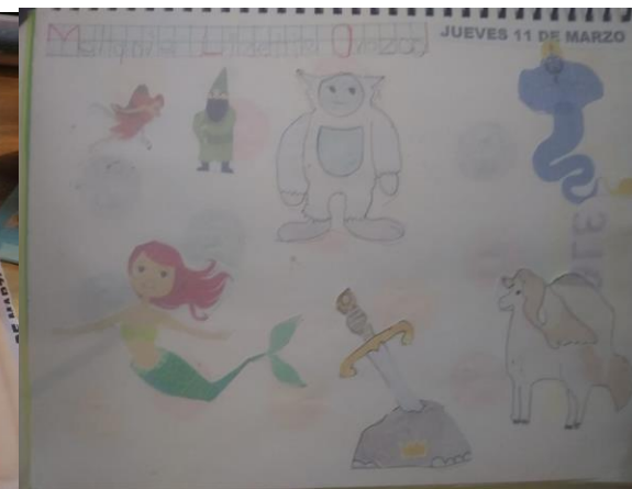
Evidencias del trabajo realizado en casa por los alumnos