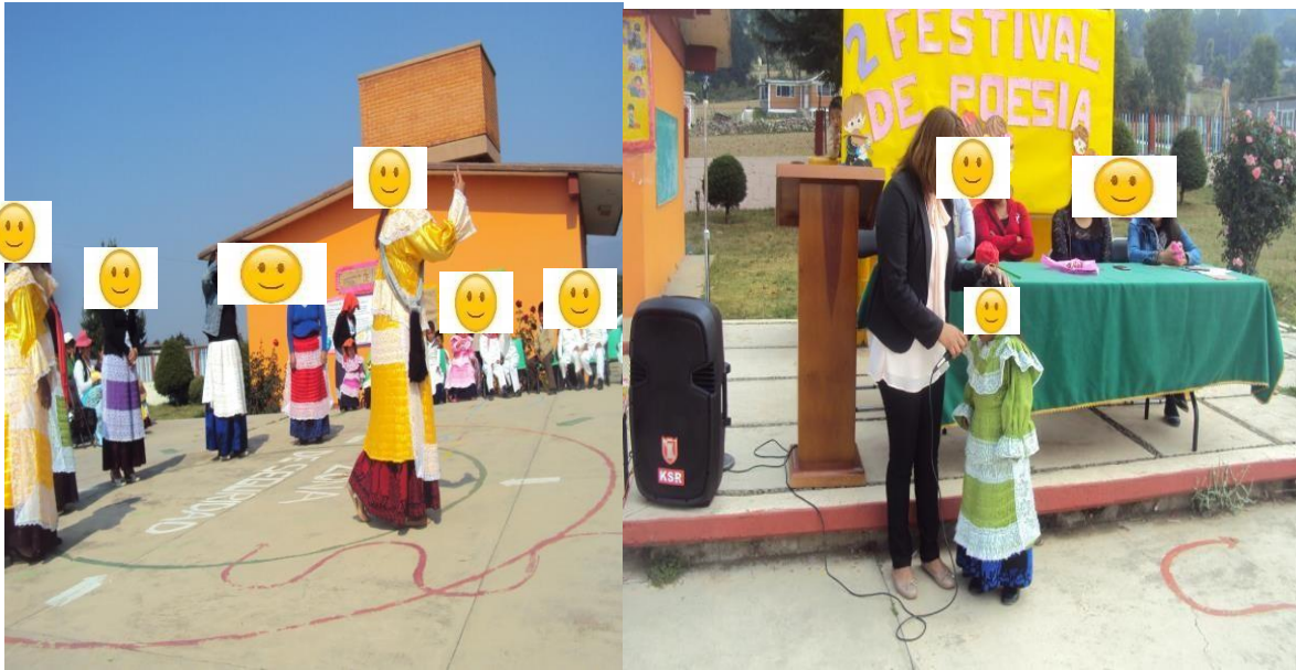
Maestra y alumna participando con poemas mazahuas