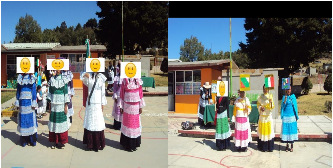
Mamás participando en ceremonia del día de la Bandera