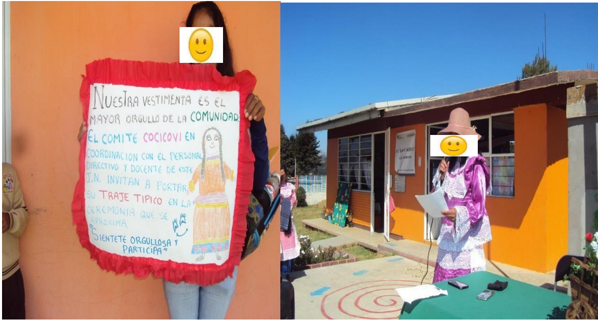
Invitación a portar traje y madre de fam. Dirige evento de ceremonia del día de la Bandera