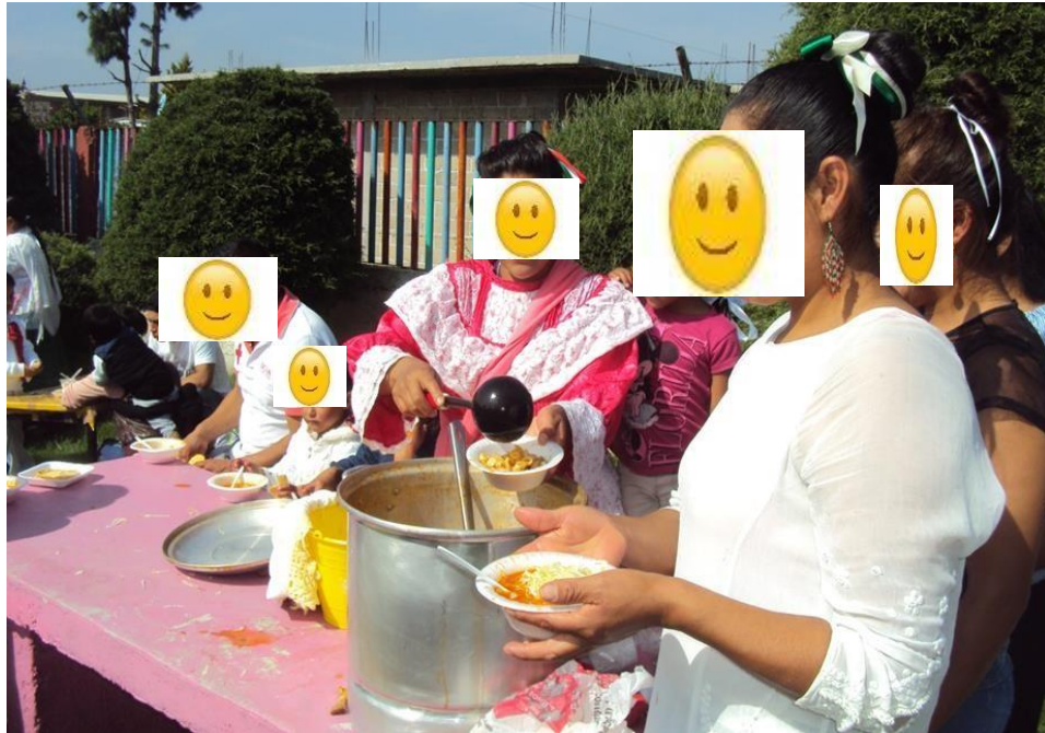
convivencia al cierre del proyecto