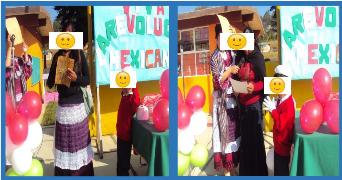
Madres de familia participan en ceremonia portando traje típico