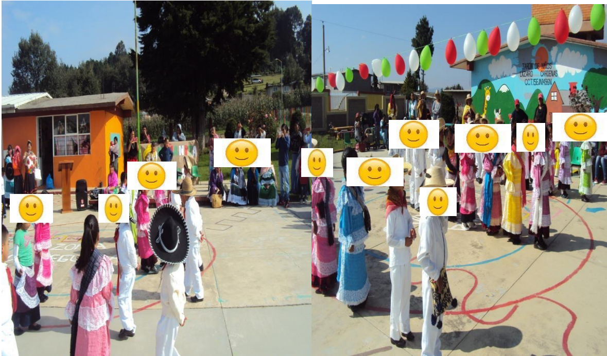
Bailes típicos del Estado de México