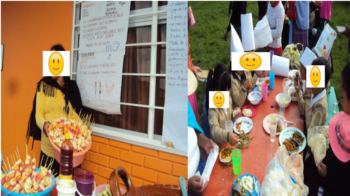
Platillos con alimentos de la comunidad