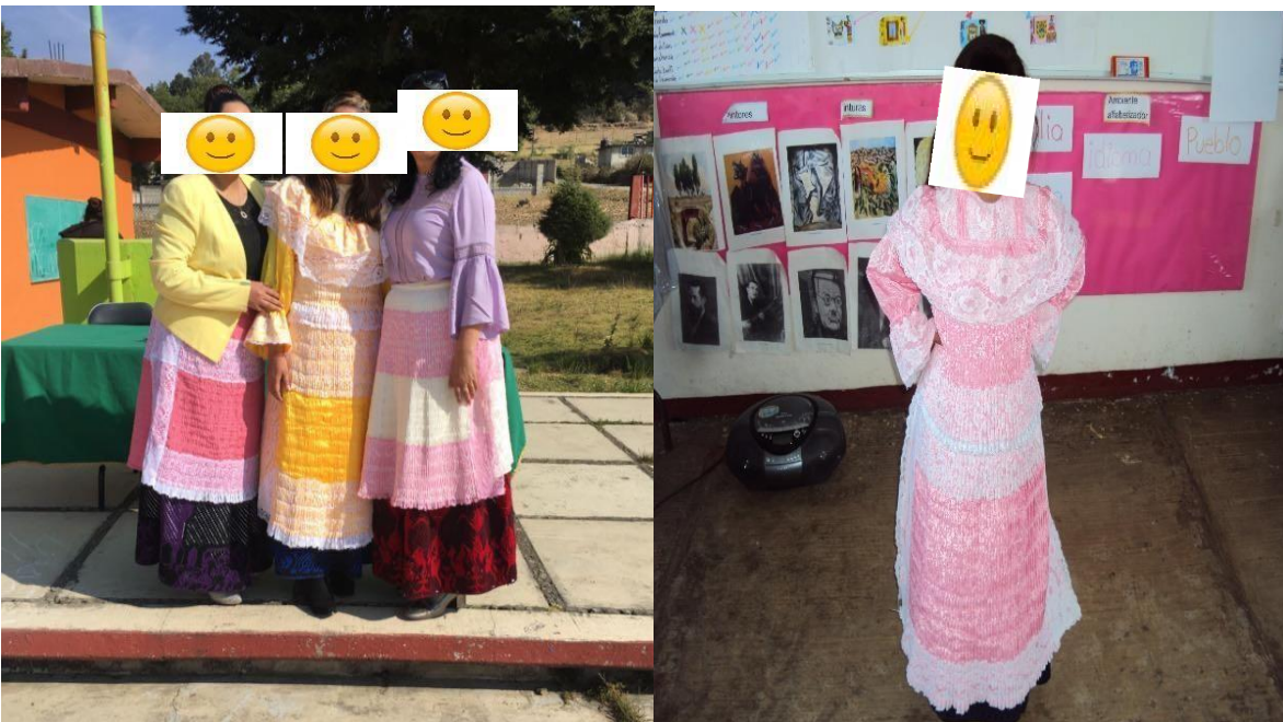
Maestras y alumna portando traje típico