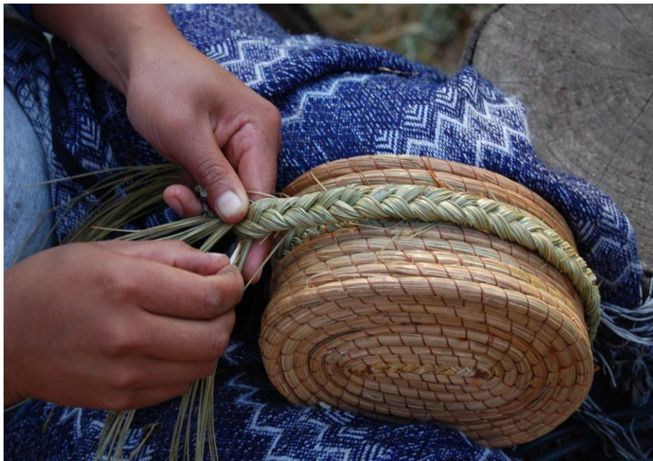
Se motivó a realizar las artesanías propias de esta región para apoyo económico