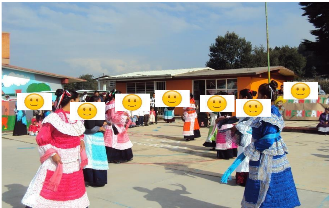
Mamás participando en un baile del Estado de México