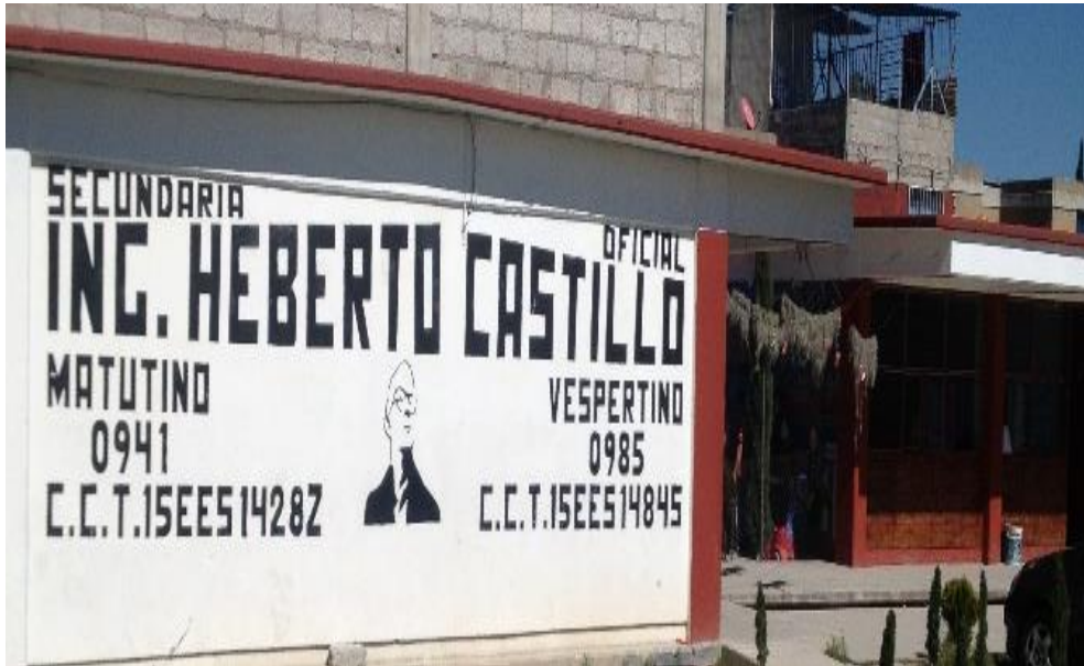
Imagen 3. Escuela Secundaria Oficial No. 0941 “Ing. Heberto Castillo”

Fuente: Elaboración propia (30 de abril de 2017)