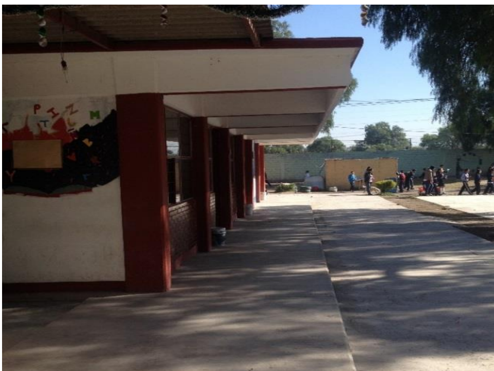
Imagen 5. Escuela Secundaria Oficial No. 0941 “Ing. Heberto Castillo”

Fuente: Elaboración propia (30 de abril de 2017)