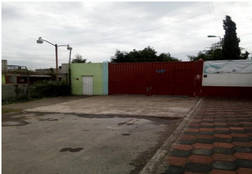
Imagen 2. Escuela Secundaria Oficial No. 0941 “Ing. Heberto Castillo”

Pasando al tema de escolarización de la población encontramos datos proporcionados por la misma autora Piñón menciona que “Las madres a diferencia de los padres, tienen menor escolaridad, los índices más altos de poca escolaridad se ubican en primaria y secundaria, un 80% para las madres y 65% para los padres” (2016:67) entonces los alumnos tienen padres y madres con escolaridad mínima, por tal motivo, apoyo educativo para realizar actividades extraescolares es poca y de acuerdo con los cuestionarios cerrados que se aplicaron a los sujetos investigados, la escolaridad de sus padres es solo primaria y secundaria. Esto nos lleva a sostener que la oferta laboral donde los padres de familia podrían incursionar son empleos donde requieran mínimos estudios y recibiendo sueldo mínimo y jornadas largas se enfrentan a situaciones económicas muy adversas y los lleva a enfrentarse a una multifuncionalidad y pluriactividad ligadas al comercio, industria o servicios.