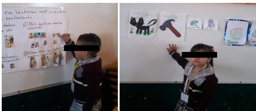
Exposición. Evidencias del trabajo realizado, fotografías originales

La exposición de diversos temas de interés de los niños y niñas es otra de las estrategias que desarrolla el lenguaje oral de ellos, el dialogo, la narración, la descripción y las explicación de los diversos intereses existentes en los pequeños, desde sus experiencias hasta sus derechos como niños, al acompañar dichas exposiciones con apoyos visuales permite que los niños observen, intuyan e identifiquen la relación existente entre lo que se dice y lo que se escribe, ya que por medio de gráficos pueden comprender de forma objetiva que lo escrito o plasmado en este es lo que el compañero o el expositor esta dando a conocer.