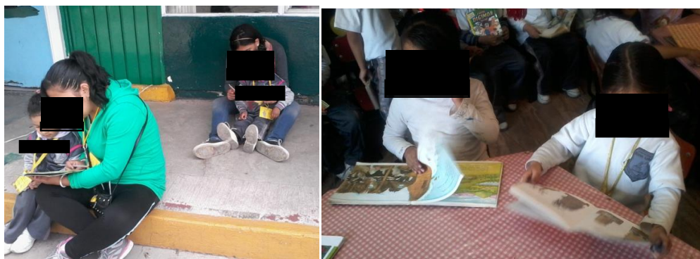
Lectura. Evidencias del trabajo realizado, fotografías originales

Otra de las estrategias es la promoción y uso de la biblioteca del aula y de la escuela, lo que permite que los menores tengan un acercamiento constante a diversos textos, requiriendo y desarrollando sus propios intereses y gustos en la elección de los textos que eligen tomar y explorar, en lo cual también se involucra el apoyo de los padres de familia, ya que algunas lecturas son acompañadas por ellos, facilitando el intercambio de ideas y de distintos puntos de vista. Algunas lecturas se realizan en la escuela y otras en casa, permitiendo ampliar el número de interlocutores o participantes en dicha lectura.