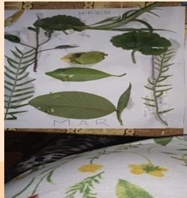
Evidencias de actividades