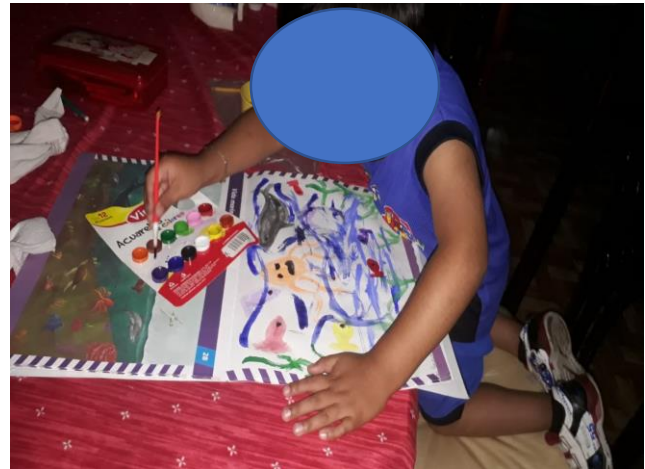
REALIZANDO ACTIVIDAD DEL LIBRO SEP, EN RELACIÓN AL CAMPO FORMATIVO EXPLORACIÓN Y CONOCIMIENTO DEL MUNDO.