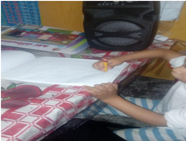
ESCUCHANDO CUENTO POR MEDIO DE LA RADIO Y REALIZANDO DIBUJO DE SU PERSONAJE FAVORITO.