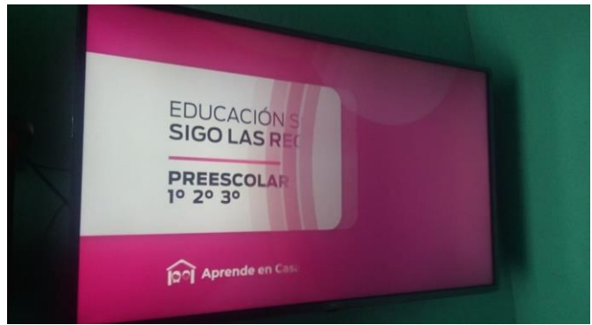
UTILIZANDO LAS TIC'S PARA TOMAR CLASES EN ESPECIFICO DE T.V.