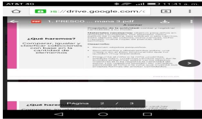
REALIZANDO ACTIVIDADES DEL CAMPO FORMATIVO: PENSAMIENTO MATEMÁTICO, UTILIZANDO COMPUTADORA PARA DARLE INDICACIONES AL ALUMNO (A).