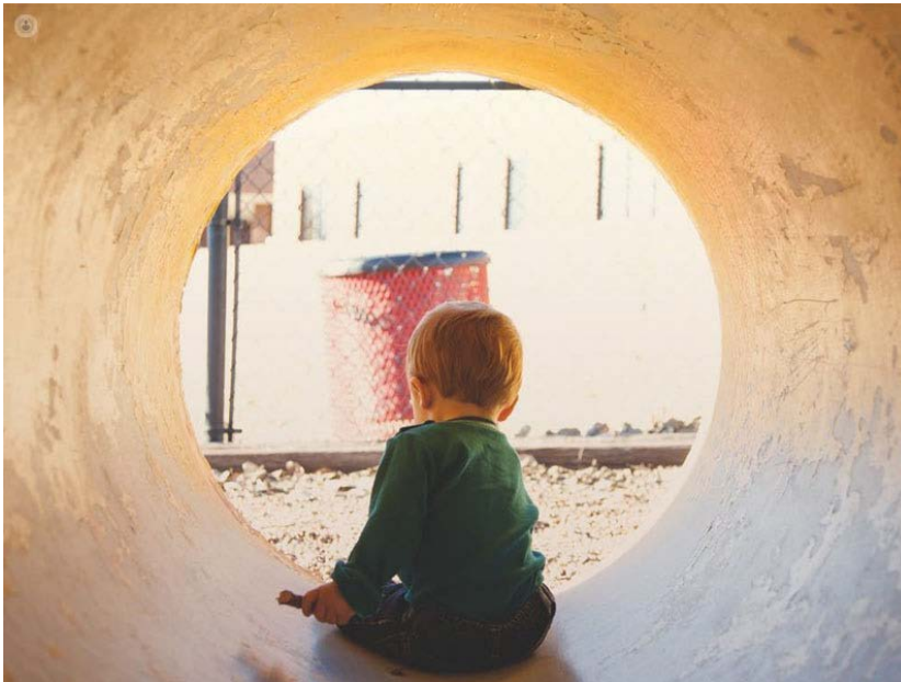
Ilustración 13. Marti R. (2020). Los trastornos mentales en la infancia. https://images.app.goo.gl/3cYDFkWEioufNqW8

Hay algunos trastornos mentales que pueden iniciar en la primera infancia, los hay irreversibles, así como, transitorios. Se pueden producir por enfermedad o lesión cerebral, por alguna sustancia tóxica o bien por alteraciones en el cerebro como, por ejemplo, ataques epilépticos demasiado prolongados.