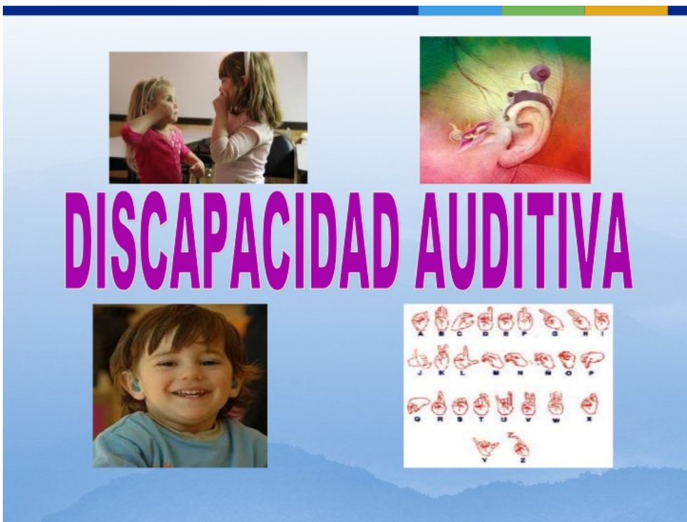
Ilustración 6. Restrepo D. (2020) Discapacidad Auditiva. (presentación de diapositivas) Slideshare. https://images.app.goo.gl/WniJgDrKgr6HZqGr6

También se le conoce como hipoacusia cuando se tiene pérdida auditiva leve, moderada o total.