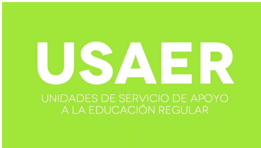
Ilustración 3. Educación Tamaulipas (2020). USAER. YouTube. https://images.app.goo.gl/wcAHHmHiqDRA5RkGA