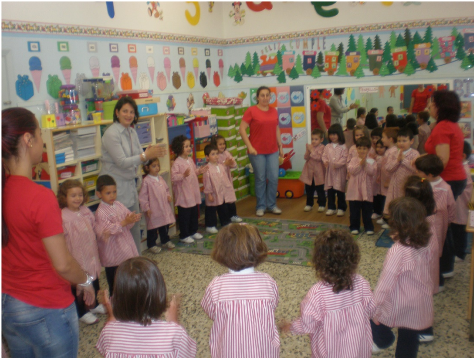
Ilustración 15. E:P. (2020) TIC Alborada. WordPress.com. Actividades NAS en el aula. https://images.app.goo.gl/N6eGKW2f2yF9KnTw8

La adecuación curricular en la planificación es libre, siente la confianza de modificar tu planificación para aprovechar tus recursos.