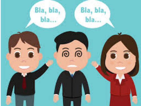
Ilustración 11. Rendón L. (2020). Trastornos de la comunicación social (pragmatico) Hola Doctor consultas. https://images.app.goo.gl/psxSfzGuc7LPtaZf8

NEE asociada a trastornos por déficit de atención con o sin hiperactividad