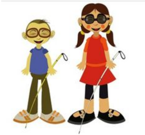
Ilustración 7. Julián C. (2020). Deficiencia visual. Pinterest. https://images.app.goo.gl/vBivMpWBmGcKWT819

Se clasifica así desde una disminución del campo visual muy limitado hasta la pérdida total de la vista