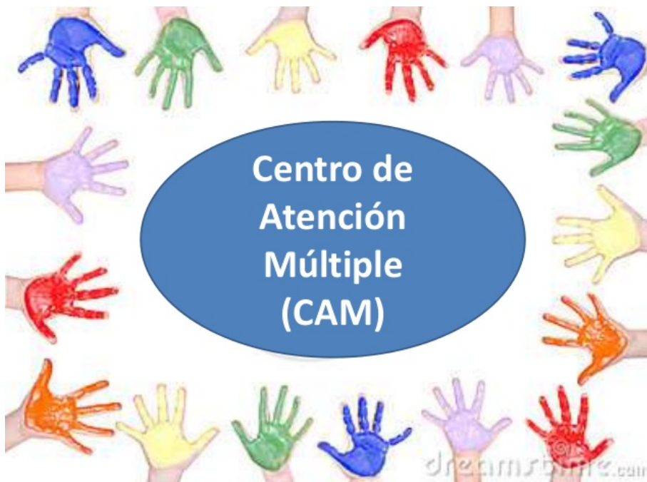
Ilustración 2. Hernández N. Montero V. (2020) Atención a la diversidad. (presentación de diapositivas) Slideshare. https://images.app.goo.gl/LRYAQAagrrG1gyuL6