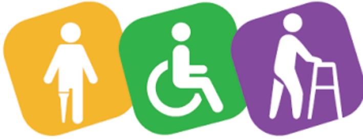
Ilustración 5. ParaPUPAS. (2020). Tipos de discapacidad física https://images.app.goo.gl/Rkr8jkXxSrAMBN6n6