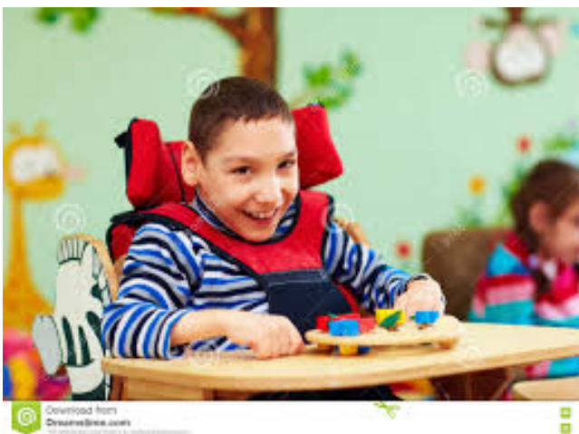
Ilustración 14. Retrato de un muchacho alegre con incapacidad en el centro de rehabilitación para niños.

En todas las NEE se requiere apoyo interinstitucional, por mencionar algunos DIF, IMSS, ISSTE, seguro popular, sector salud, etc.