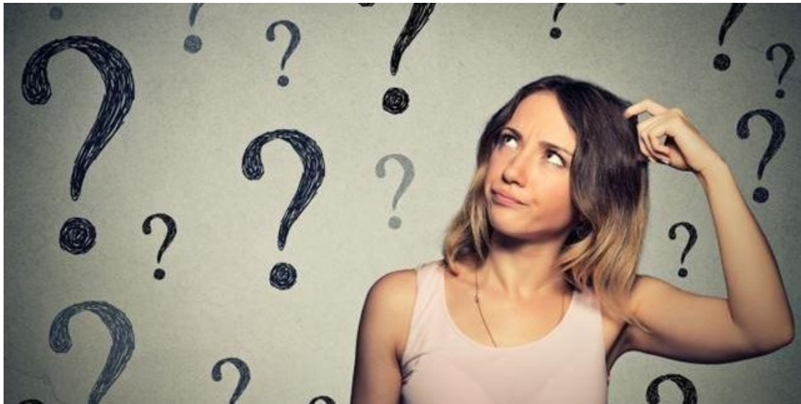
Ilustración 1. Depro Consultores (2020) La demencia del preocupado Nuevo Termino. https://images.app.goo.gl/8UXCqncck41WZ5c18

La incertidumbre de ignorar como trabajar con los alumnos con NEE (Necesidades Educativas Especiales) me ha llevado a una investigación para convertirla en experiencias, algunas de ellas motivadoras, otras de enseñanza.