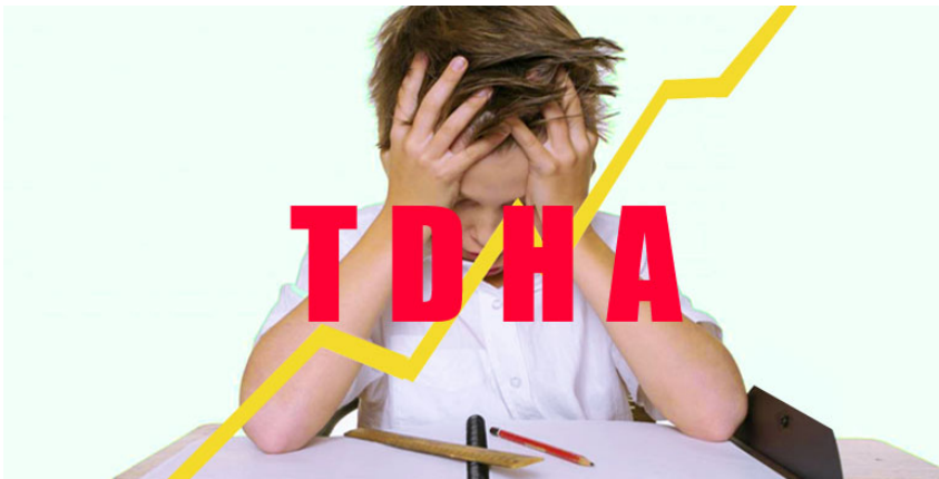
Ilustración 12. COMSERPRO.com (2020). Sabes qué es el déficit de atención e hiperactividad?. https://images.app.goo.gl/hcPKgSxvwbhvwr67

NEE asociada a otros trastornos mentales.