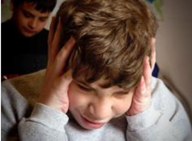
Ilustración 8. @Rima. (2020). Directrices para la internación de niños con espectro autista.Red Informatica de Medicina Avanzada. https://images.app.goo.gl/ffg1EZnc1LCTXYsS6

NEE asociada a trastornos graves de conducta