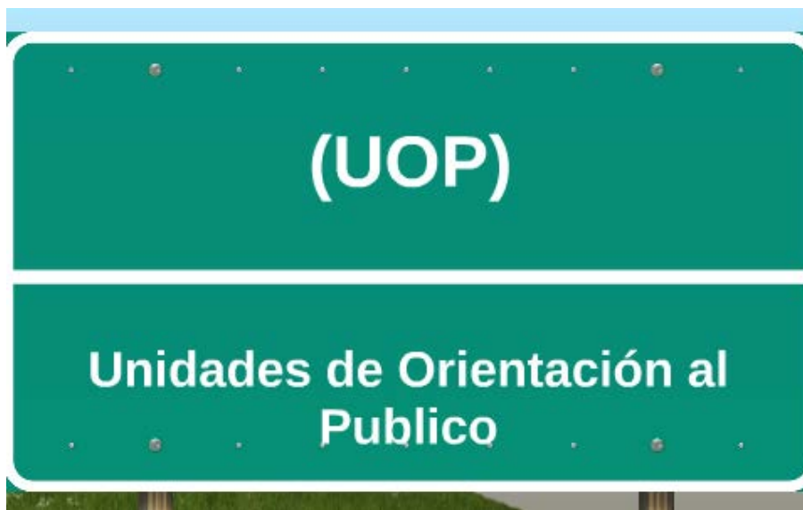
Ilustración 4. Jesús Alonso. (2020). UOP. (diapositivas de presentación). prezi. https://images.app.goo.gl/7owvH3CjrQC9j16F9

Consultado el 13 de agosto de 2020 https://sites.google.com/a/cetys.net/educacion-especial/historia