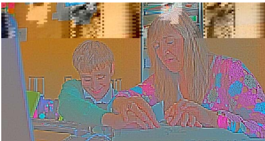
Ilustración 16. Toda disca. (2020) Un niño con discapacidad visual en la escuela. https://images.app.goo.gl/Y7QziWw7Aj63jFVm6

El alumno es el centro del aprendizaje, permítete que integre la antigua información con la que ha adquirido recientemente, capta su atención para que pueda concentrarse en lo que le estás diciendo o mostrando, evita el aburrimiento y la confusión. Tus clases no deben ser tan largas hablando de periodos de tiempo y mucho menos discursivas, ten en cuenta la edad de los chicos.