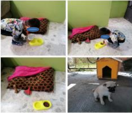
Video de un veterinario