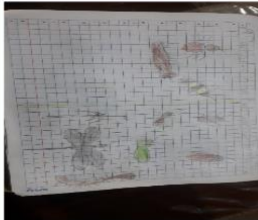
registro de los insectos a partir de la lámina didáctica.