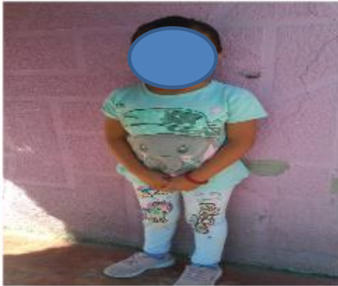
Baile imitando animales