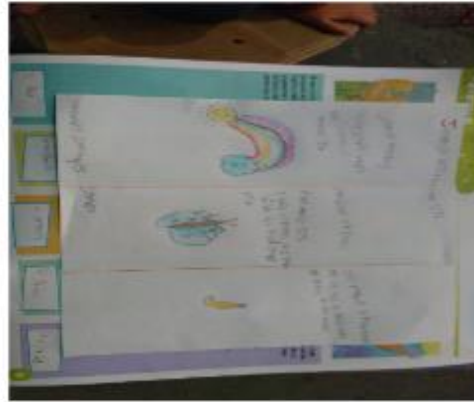
Adivinanzas, libro mi álbum