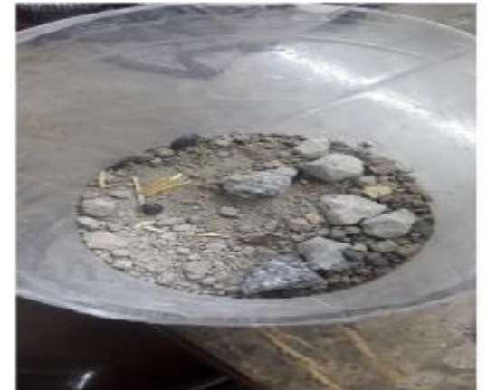
Crear un terrario con los insectos atrapados