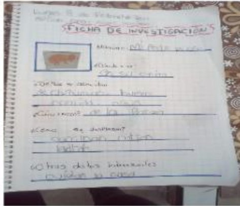
Investigación sobre un animal en específico