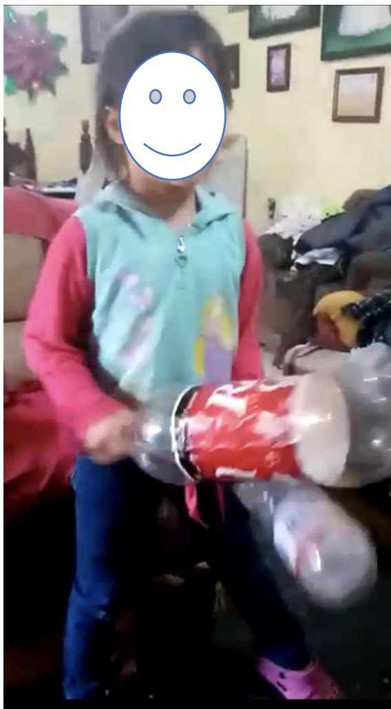
Evidencia de trabajo