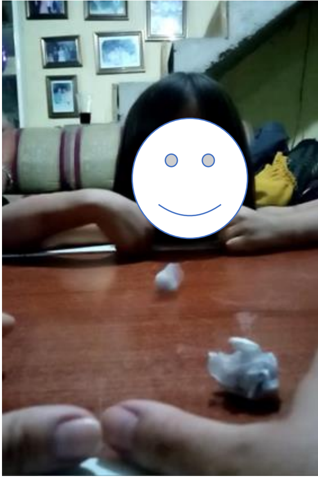
Evidencia de trabajo