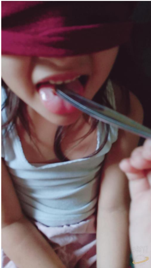
Evidencia de trabajo