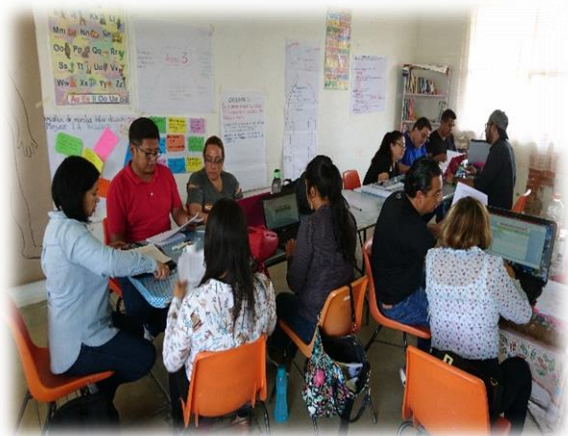
Análisis de CEAJA's sobre resultados de metas del ciclo escolar anterior, como referente para el