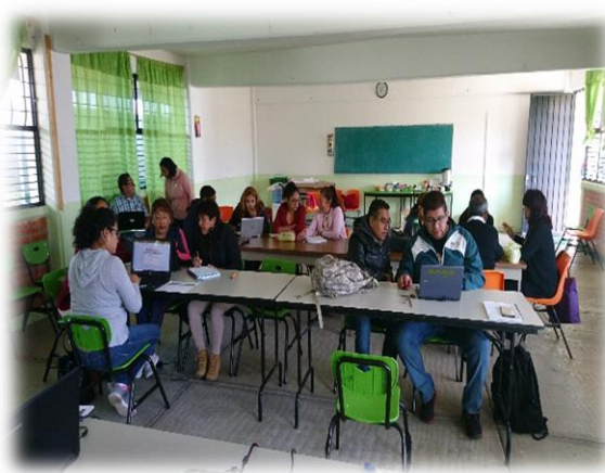
Trabajo por CEAJA's, búsqueda de información y organización de contenido.