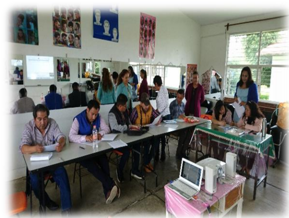
Trabajo individual, revisión de formatos y Cuadros como apoyo a la organización de su nueva información